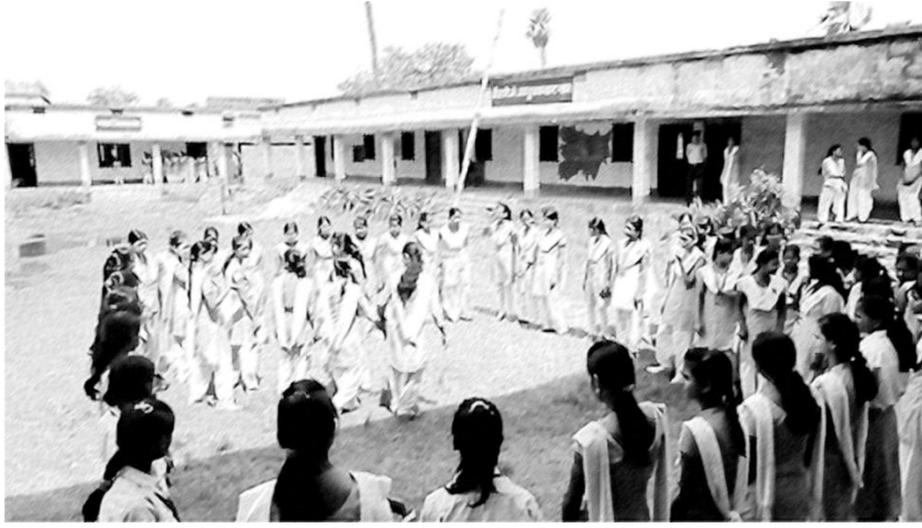
चित्र 1 कक्षा से बाहर गणित को मूर्त रूप देती हुई एक कक्षा।

स्कूल के मैदान में काम करने के लिए छात्र-छात्राओं से कहते समय आपको हमेशा यह सुनिश्चित करना चाहिए कि आपके छात्र आती-जाती हुई गाड़ियों या निर्माण कार्य जैसे सामना किए जा सकने वाले सुरक्षा खतरों के प्रति जागरूक हैं और वे मौसम में होने वाले बदलावों के लिए भी तैयार हैं।