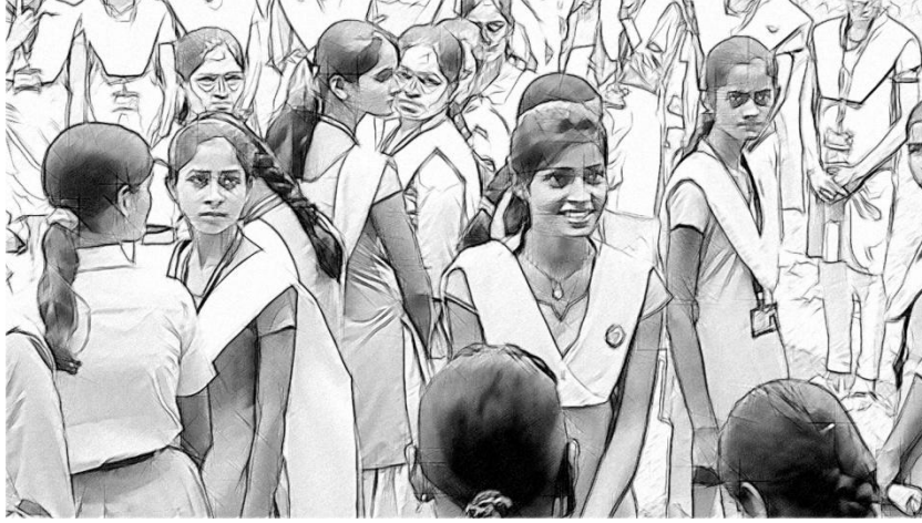
चित्र 2 कक्षा के बाहर 'व्यक्ति गणित'।

लगभग 20 छात्र-छात्राओं के समूह का उपयोग करें ताकि श्रेणियों में विभाजित करने के लिए पर्याप्त छात्र हों लेकिन इतने भी न हों कि आप जो चित्रित करना चाहते हैं वही धुंधला हो जाए।