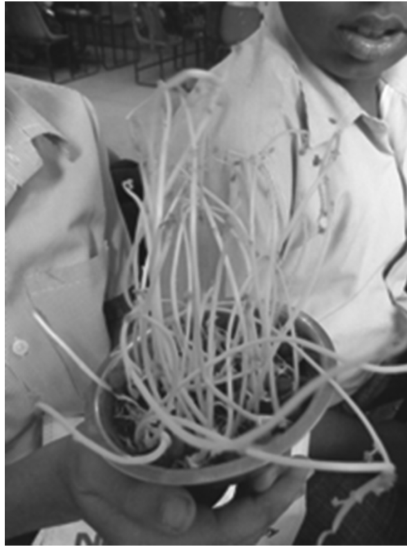
चित्र 3 बिना प्रकाश के बीज।

मैंने विद्यार्थियों को अपने अवलोकन रिकॉर्ड करने के लिए एक आसान सा चार्ट दिया और उनसे अपने बीजों की देखभाल करने के लिए कहा और दो सप्ताह तक कम से कम हर दो दिनों पर अपने अवलोकन को रिकॉर्ड करने के लिए कहा। कुछ विद्यार्थियों ने अपने अवलोकन रिकॉर्ड करने के लिए चित्र बनाए। अन्य ने लेबल और शीर्षक लिखे। सभी ने वृद्धि की जाँच को एक पैमाने से मापा।