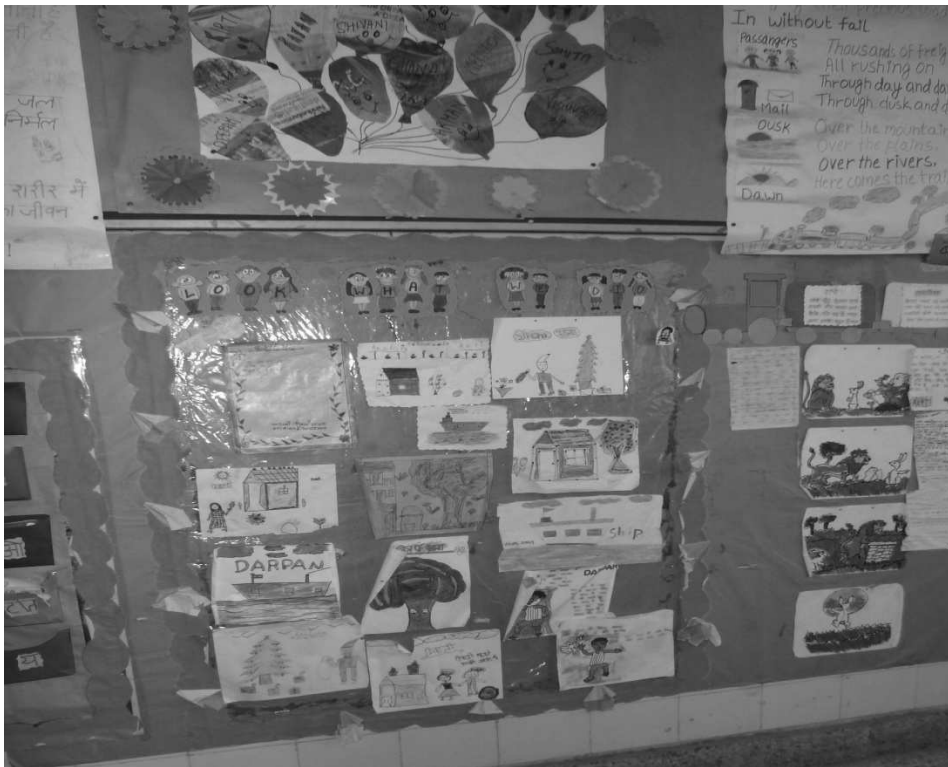
चित्र 1 रंगारंग और प्रेरणादायक कक्षा आपके विद्यार्थियों के कल्याण, प्रेरणा और उपलब्धि को बेहतर बनाएगी।

शिक्षण की गतिविधियां उस समय सर्वाधिक प्रेरणादायक होती हैं, जब वे विद्यार्थियों को या तो समस्या का व्यावहारिक रूप से अन्वेषण करने के लिए जोड़ते हैं। या समस्या के समाधान के द्वारा चिंतन के कौशलों को विकसित करने के लिए सक्रिय रूप से जोड़ते हैं। शिक्षक के रूप में आपको इस पथ पर अपने विद्यार्थियों को अग्रसर करने के लिए पहल करनी होती है। इसके बाद आपके विद्यार्थियों को घनिष्ठ रूप से संबद्ध किया जा सकता है। इसके अलावा आपको इस बात पर सावधानीपूर्वक विचार करने की ज़रूरत है कि आप कक्षा में किस प्रकार का भौतिक परिवेश चाहते हैं। अगर आप कुछ सामग्रियों के साथ स्कूल में काम करते हैं, तो हो सकता है कि यह आसान न हो, परन्तु उपायकुशल बनकर आप रंगारंग और प्रेरणादायक कक्षा का निर्माण कर सकते हैं। (चित्र 1)। इससे विद्यार्थियों के सुख, प्रेरणा और उपलब्धि पर उल्लेखनीय फर्क आयेगा।