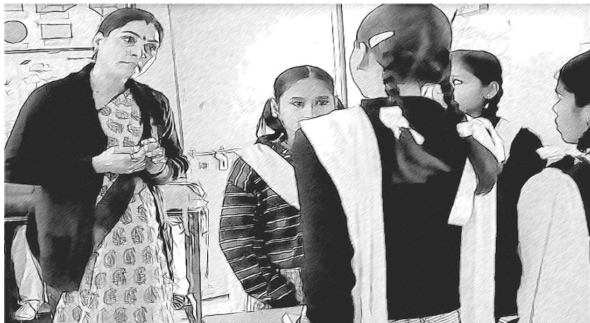
ଚିତ୍ର-୫ ଶିକ୍ଷକ ତାଙ୍କ ଶ୍ରେଣୀର ଅଭ୍ୟାସକୁ ପରିବର୍ତ୍ତନ କରାଉଛନ୍ତି ।

ମୁଁ ବହୁତ ଅନୁସନ୍ଧିଷ୍ଟୁ ଥିଲି ଜାଣିବା ପାଇଁ କିପରି ଶିକ୍ଷକମାନେ ସେମାନଙ୍କର ଅଭ୍ୟାସକୁ ବଢ଼ାନ୍ତି ଓ ଟେସ୍ ଇଣ୍ଡିଆର ମୁକ୍ତ ସମ୍ବଳକୁ ବ୍ୟବହାର କରନ୍ତି । ମୁଁ ଶିକ୍ଷକମାନଙ୍କୁ ଉତ୍ସାହିତ କରି ସେମାନଙ୍କ ଅଭିଜ୍ଞତା ବିଷୟରେ ମୋ ସହ କଥା ହେବାକୁ, ଯେଉଁଠାକି ମତେ କିଛି ସଂକେତ ଦେଲା ଯେ, ଜିନିଷ କିପରି ଗଲେ । ବର୍ତ୍ତମାନ ମୁଁ ଯେତେବେଳେ ସ୍କୁଲ ଭିତରକୁ ଗଲି, ମୁଁ ଶୁଣିବାକୁ ଚେଷ୍ଟା କଲି କ’ଣ କ’ଣ ଆଲୋଚନା ହୁଏ ଏବଂ କିଏ ଶ୍ରେଣୀରେ କଥା କହେ ।