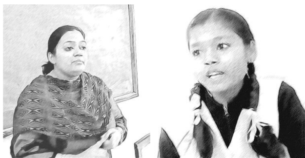
ଚିତ୍ର ୧ : ଶିକ୍ଷାର୍ଥୀଙ୍କର ଭାଗିଦାରିତା ବଢ଼ିବ ଯେତେବେଳେ ଶିକ୍ଷକ ଶିକ୍ଷୟିତ୍ରୀ ପ୍ରକ୍ରିୟାରେ ଭାଗନେବେ

ଗବେଷଣା ଏହା ସହିତ କେମିତି । ବାସ୍ତବତା ଏହାକି ଏହାକୁ କାର୍ଯ୍ୟକାରୀ କରିବା କଷ୍ଟକର । ଅନେକ ଶିକ୍ଷକ, ମୁଖ୍ୟତଃ ମାଧ୍ୟମିକ ସ୍ତରରେ କୁହନ୍ତି ଯେ, ଅନେକ କାରଣ ଏପରିକି ବଡ଼ ଶ୍ରେଣୀ ଓ ପରୀକ୍ଷା ପାଠ୍ୟସୂଚୀ ସେମାନଙ୍କୁ ଶିକ୍ଷାର୍ଥୀ କେନ୍ଦ୍ରିକ ପାଠ ପଢ଼ାଇବାକୁ ସୁଯୋଗ ଦେଉନାହିଁ । ଟେସ୍-ଇଣ୍ଡିଆ ମୁକ୍ତ ଶୈକ୍ଷିକ ସମ୍ବଳଗୁଡ଼ିକ ପ୍ରୟୋଗାତ୍ମକ ଉଦାହରଣ ଅଟେ – ଶିକ୍ଷଣକାର୍ଯ୍ୟ ଓ ଘଟଣା ବିବରଣୀ ଆକାରରେ ଶିକ୍ଷକମାନଙ୍କ ପାଇଁ ଯାହାକି ଶ୍ରେଣୀରେ ସେମାନେ ଏହାକୁ କରାଇପାରିବେ ଯାହା ସେମାନଙ୍କର ସେହି ଅସୁବିଧାକୁ ଦୂର କରିବ ।