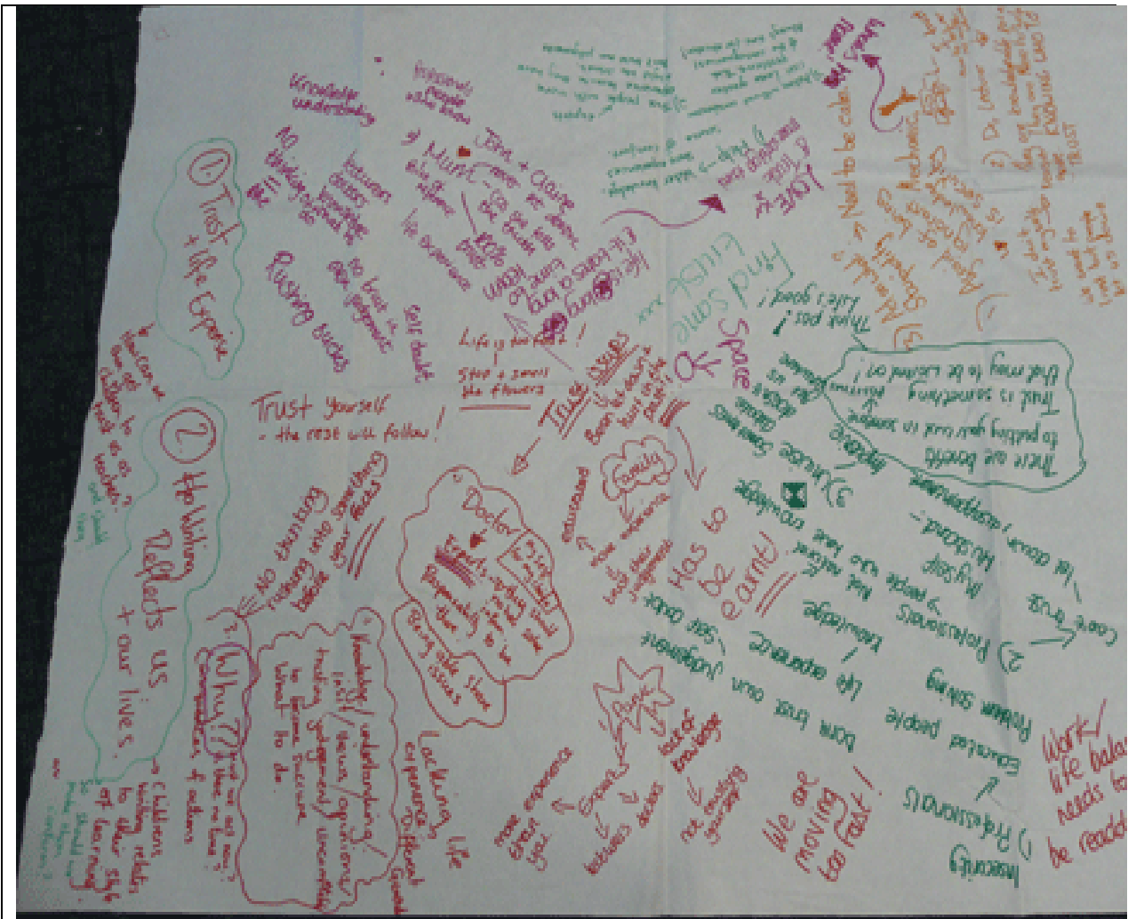
ଚିତ୍ର ୭ : ଆପଣଙ୍କର ଶିକ୍ଷକଙ୍କର ଧାରଣାର ଚିତ୍ର

ଯେ କୌଣସି ଏକ ଆହ୍ୱାନମୂଳକ କାମ ପାଇଁ ତୁମକୁ ସମସ୍ତ ସାରାଂଶ ବାହାର କରିବାକୁ ପଡ଼ିବ । ସମସ୍ତଙ୍କ ମତାମତକୁ ଧନ୍ୟବାଦ ପୂର୍ବକ ଏକତ୍ରିତ କରିବାକୁ ପଡ଼ିବ । ସମସ୍ତଙ୍କ ଦେଖିବା ପାଇଁ ଏହାକୁ ଛାଡ଼ିଦେଇ ପାରିବେ ଏବଂ ମୁଦ୍ରିତ କରି ଭବିଷ୍ୟତରେ ବ୍ୟବହାର ପାଇଁ ରଖିପାରିବେ ।