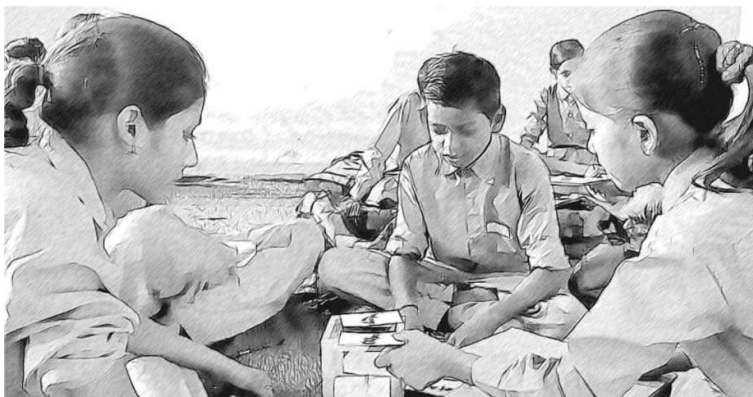
ଚିତ୍ର ୩ : ବିଦ୍ୟାଳୟରେ କ'ଣ ଉନ୍ନତି ହେବା ଦରକାର ?

ଗୁଣାତ୍ମକ ଅଭ୍ୟାସ ସହ ସଂପର୍କିତ ହୋଇଛି ଯାହାଦ୍ୱାରା ତୁମେ ପ୍ରତ୍ୟେକ ଚେଷ୍ଟା ଲକ୍ଷିଆ ସମ୍ବଳ ସହ ସଂପର୍କିତ ହୋଇପାରିବ। ଚେଷ୍ଟା ଲକ୍ଷିଆ ମୁକ୍ତ ଶୈକ୍ଷିକ ସମ୍ବଳଗୁଡ଼ିକର ତାଲିକା ପ୍ରସ୍ତୁତ କର (ପ୍ରାରମ୍ଭିକ-ଗଣିତ, ପ୍ରାରମ୍ଭିକ ବିଜ୍ଞାନ, ପ୍ରାରମ୍ଭିକ ଇଂରାଜୀ) ଯାହାକୁ ତୁମେ ତୁମ ସ୍କୁଲରେ ବ୍ୟବହାର କରି ତୁମର ଏହି ଦକ୍ଷତାକୁ ଶିକ୍ଷଣ କ୍ଷେତ୍ରରେ ବୃଦ୍ଧି କରାଯାଇଛି।