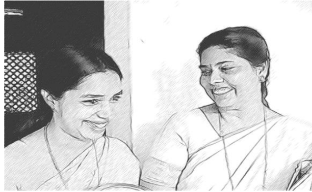
ଚିତ୍ର ୬ : ପ୍ରତିଫଳନ ଓ ପାଳନ

ତୁମର କାମ ଶେଷରେ ତୁମେ ନିଶ୍ଚିତଭାବରେ ଏକ ବୈଠକର ଆୟୋଜନ କରିବ, ଯେଉଁଥିରେ ଶିକ୍ଷଣ ଓ ଶିକ୍ଷାଦାନର ମୁଖ୍ୟ ଲକ୍ଷ୍ୟ ଉପରେ ହୋଇଥିବ । କିଛି କାମ ପାଇଁ ଅନ୍ୟକୁ ଧନ୍ୟବାଦ ଦେବ ଓ ଏଥିପାଇଁ ଖୁସି ମନାଇବ । ଏଥିପାଇଁ ତୁମକୁ ତୁମର ଶିକ୍ଷଣ ଡାଇରାକୁ ଦେଖିବାକୁ ପଡ଼ିବ ଏବଂ ମନେପକାଇବାକୁ ହେବ ତୁମେ କେଉଁଠାରୁ କାମ ଆରମ୍ଭ କରିଥିଲ । ଏହି ବୈଠକଟି ଏକ ଆକ୍ରମଣାତ୍ମକ ଓ ପରସ୍ପର ଆଲୋଚନାମୂଳକ ହେବ ।