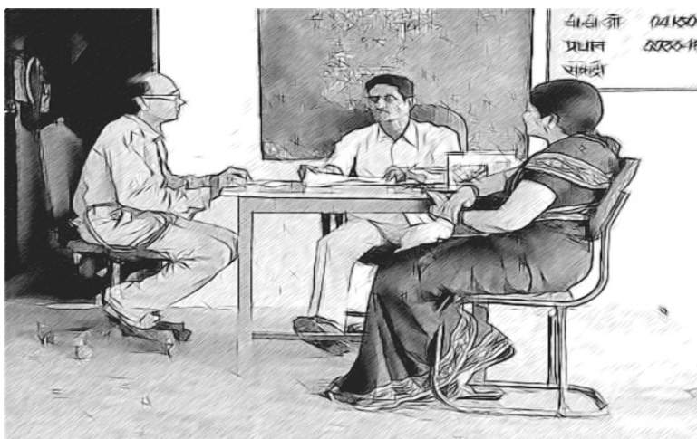
ଚିତ୍ର ୪ : ସ୍କୁଲର ମୁଖ୍ୟ ଶିକ୍ଷକମାନଙ୍କୁ ନିୟୋଜିତ କରିବା ଦରକାର ।

ବରିଷ୍ଠ ଶିକ୍ଷକଙ୍କ ସହ କାମ କରିବା ଦ୍ୱାରା ସ୍କୁଲରେ ଶିକ୍ଷଣ ବ୍ୟବସ୍ଥାକୁ ଉନ୍ନତ କରିବା ପାଇଁ ତୁମର ମତାମତକୁ ମୁଖ୍ୟଙ୍କ ସହ ଆଲୋଚନା କରିପାରିବ । ଟେସ୍ ଇଣ୍ଡିଆର ୬୦ଟି ଉପଲକ୍ଷ୍ୟ ମୁକ୍ତ ଶୈକ୍ଷିକ ସମ୍ବଳକୁ ସଂପୂର୍ଣ୍ଣରୂପେ ଦେଖ । ମନେରଖ, ବାକ୍ୟଗୁଡ଼ିକ ସହଜରେ ଅନ୍ୟ ବିଷୟରେ ଗ୍ରହଣ କରାଯାଇପାରିବ ଓ ଏହା ଏପରି ଯେ ତୁମେ ଏହାକୁ କରିବା ଉଚିତ୍ କିନ୍ତୁ ପ୍ରଥମେ ମୁକ୍ତ ଶୈକ୍ଷିକ ସମ୍ବଳ ସହ ପରିଚିତ ହେବା ଆବଶ୍ୟକ ।