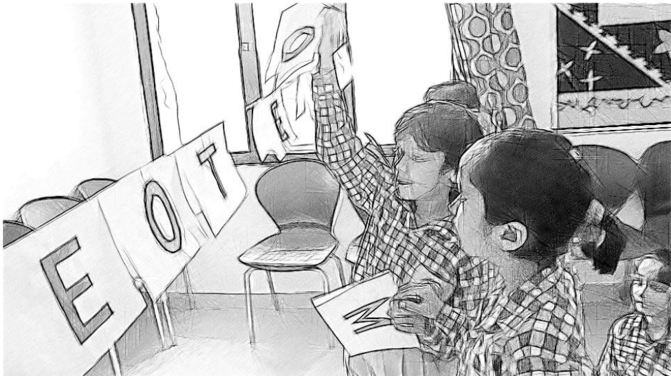
एक वर्ण कार्ड गतिविधि।

आपने जो गतिविधि चुनी है, वह विद्यार्थियों के साथ करें। इसके बाद इस बारे में सोचें कि क्या अच्छा हुआ और किसे आप अगली बार अलग तरीके से कर सकते हैं।