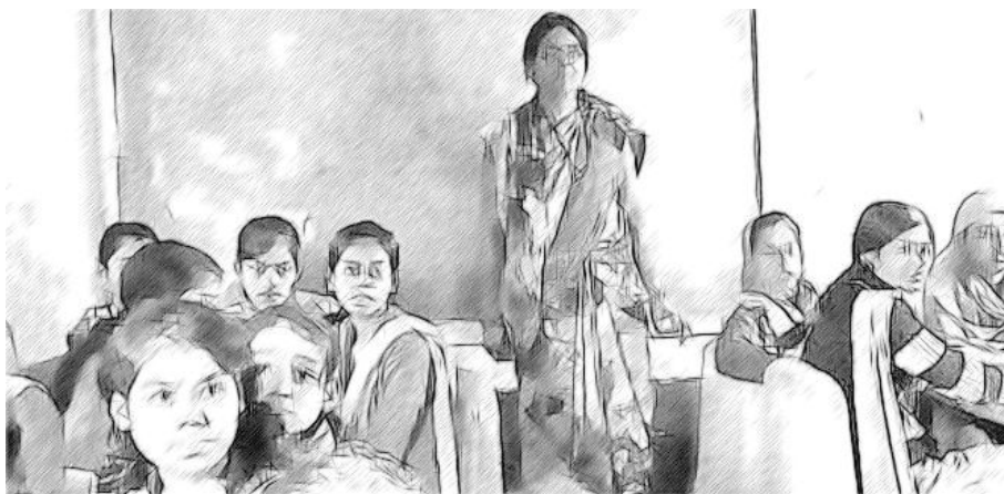
ଚିତ୍ର ୧ ପର୍ଯ୍ୟବେକ୍ଷଣ ମାଧ୍ୟମରେ ସତ୍ୟାସତ୍ୟ ସଂଗ୍ରହ

ବିଦ୍ୟାଳୟ ପରିଦର୍ଶନରେ ଯାଇ ଯଦି ଆପଣ ନିରନ୍ତରଭାବେ ତଥ୍ୟ ସଂଗ୍ରହ କରୁ ନାହାନ୍ତି କିମ୍ବା ଶିକ୍ଷକଙ୍କ ସହ କଥାବାର୍ତ୍ତା କରୁ ନାହାନ୍ତି, ତାହେଲେ ଶିକ୍ଷାର୍ଥୀଙ୍କର ଶିକ୍ଷାର ଅବନତି ନ ଘଟିବା ପର୍ଯ୍ୟନ୍ତ ଆପଣ ସେମାନଙ୍କର ନିମ୍ନ ପ୍ରଦର୍ଶନ ସମ୍ବନ୍ଧରେ ଆଦୌ ଅବଗତ ହୋଇପାରିବେ ନାହିଁ । ଏହି କାରଣ ପାଇଁ ସବୁ ସମୟରେ ତଦାରଖର ଆବଶ୍ୟକତା ରହିଛି ଏବଂ ଏହା ଆପଣଙ୍କ ଦୈନିଦିନ କାର୍ଯ୍ୟର ଏକ ଅଂଶବିଶେଷ ହେବା ଆବଶ୍ୟକ । ତଦାରଖ କରିବା ଦ୍ୱାରା ଆପଣ ଭଲ ପ୍ରଦର୍ଶନ ଗୁଡ଼ିକୁ ଜାଣିପାରିବେ ଏବଂ କେଉଁ ଶିକ୍ଷକମାନେ ଭଲ ପ୍ରଦର୍ଶନ କରୁଛନ୍ତି ସେମାନଙ୍କୁ ଚିହ୍ନଟ କରିବେ ।