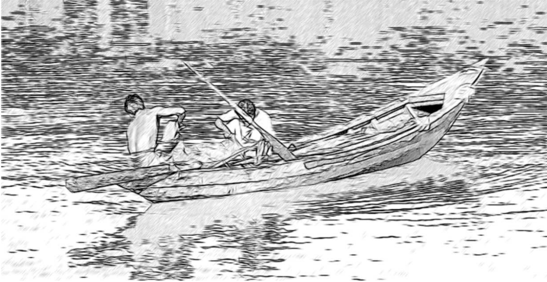
चित्र 1 नदी पार करते हुए लोग।

खेलते-खेलते वे एक-दूसरे से बात कर रहे थे। दो लड़कियां अपने प्रत्येक डिब्बे में एक-एक पत्थर रख रही थीं और उन्हें टब में तैरा रही थीं। जब मैंने उनसे पूछा कि वे क्या कर रही हैं? तो उन्होंने कहा कि वे लोगों को नदी पार करवा रही हैं और लड़के पत्थरों को नाव से लेकर सड़क के पार ले जा रहे थे। एक लड़का बोला— 'अगर मैं सारे पत्थर इस बर्तन में रख दूँ तो यह काम जल्दी हो जाएगा।' उसने ऐसा किया और वह टब डूब गया। दूसरा लड़का बोला कि तुम्हें एक बार में एक पत्थर रखना होगा। इसी समय उनमें से एक लड़की बोली कि एक बार में केवल एक आदमी होना चाहिए, 'गाँव में मेरे पिता भी लोगों को इसी तरह नदी पार कराते हैं' [चित्र 1]।