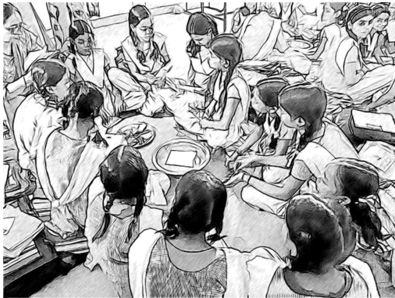
चित्र 2 विद्यार्थी अनुमान लगा रहे हैं कि क्या तैरेगा और क्या डूबेगा।

जब सभी समूहों ने अपना कार्य पूरा कर लिया तो मैंने प्रत्येक को एक कटोरा पानी दिया [चित्र 2]। मैंने पुराने कटोरों और एक बड़े से खाली टिन का इस्तेमाल किया। क्योंकि स्कूल में हमारे पास ज्यादा उपकरण नहीं हैं। मैंने उन्हें पाँच मिनट दिए और कहा कि वे अपने विचारों का परीक्षण करें और अपने-अपने परिणाम नोट करें। जिन वस्तुओं ने उनके अनुमान के अनुसार परिणाम दिया उन पर सही का निशान लगाएँ और बाकियों को बिना निशान के छोड़ दें। उन्होंने जिन वस्तुओं का परीक्षण किया उनमें से, विद्यार्थियों का सुझाव था कि पत्थर, सिक्का, कंक्रीट का टुकड़ा, लकड़ी का टुकड़ा, धातु का टुकड़ा, चम्मच, बर्तन, थाली, पंख, कागज़ और पेंसिल डूब जाएंगे।