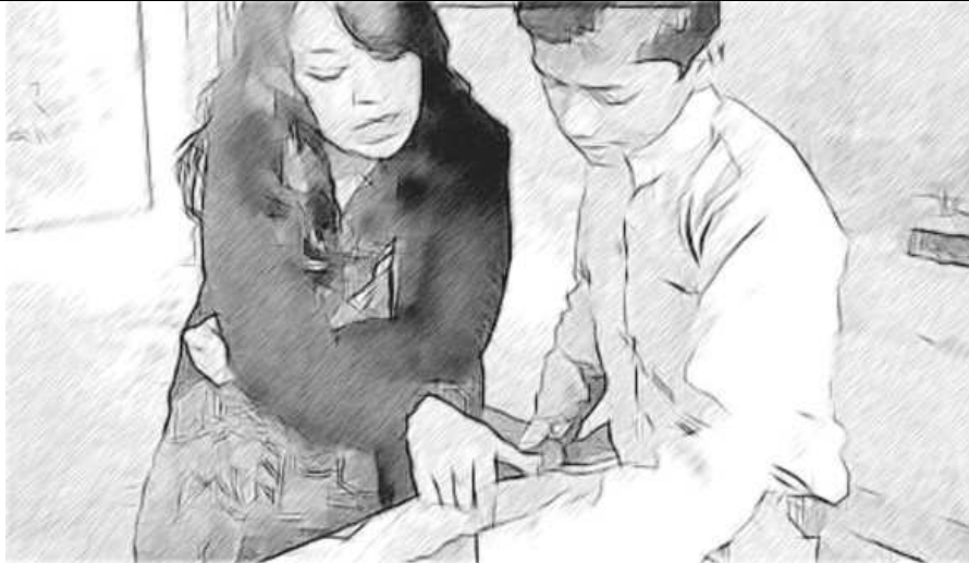
चित्र 1 जहाँ आवश्यक हो, अपने विद्यार्थियों की मदद करें।

जिन विद्यार्थियों को परेशानी हो रही हो, उनके लिए कथनों को जोर से पढ़ कर सुनाना फ़ायदेमंद होगा।