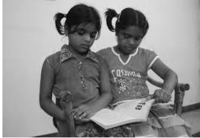
चित्र 3: जोड़ियों में पठन।

जोड़ियों में कार्य के द्वारा, दो छात्र एक पुस्तक को साझा करते हैं और बारी-बारी से एक-एक वाक्य, अनुच्छेद या पृष्ठ पढ़ते हैं (चित्र 3)। पहला पाठक पढ़ता है, जबकि दूसरा पाठक उसे सुनता है और साथ-साथ बढ़ता है। जहाँ पहला पाठक रुकता है, दूसरा पाठक उसके आगे से पढ़ना जारी रखता है। यदि दोनों में से किसी को भी कठिनाई होती है या वे गलती करते हैं, तो उनका साथी उनकी सहायता कर सकता है या उनकी गलती सुधार सकता है।