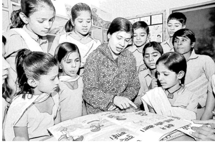
चित्र 1: कक्षा में एक पुस्तक के बारे में बात करना।

अपनी कक्षा में पुस्तक पर बात करने के लिए एक संक्षिप्त सत्र की योजना बनाएँ। यह 30 मिनट से ज्यादा समय का नहीं होनी चाहिए।