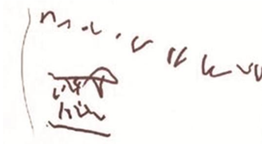
चित्र 1 एक चार वर्षीय बालिका द्वारा 'लेखन'।

चित्र 1 को देखें, जो एक चार-वर्षीय बालिका के 'लेखन' को दर्शाता है। उसने आत्मविश्वास के साथ अपनी प्री-स्कूल शिक्षक को बताया कि वह संख्याएँ और वर्ण लिख रही है। आप एक लेखन-अंश के रूप में इसका मूल्यांकन किस प्रकार करेंगे, या क्या आपको लगता है कि यह केवल निरर्थक कलम चलाना है? इस लेखन अंश के बारे में अपने विद्यालय के अन्य शिक्षकों से बात करें। इस पर उनकी क्या प्रतिक्रिया है?