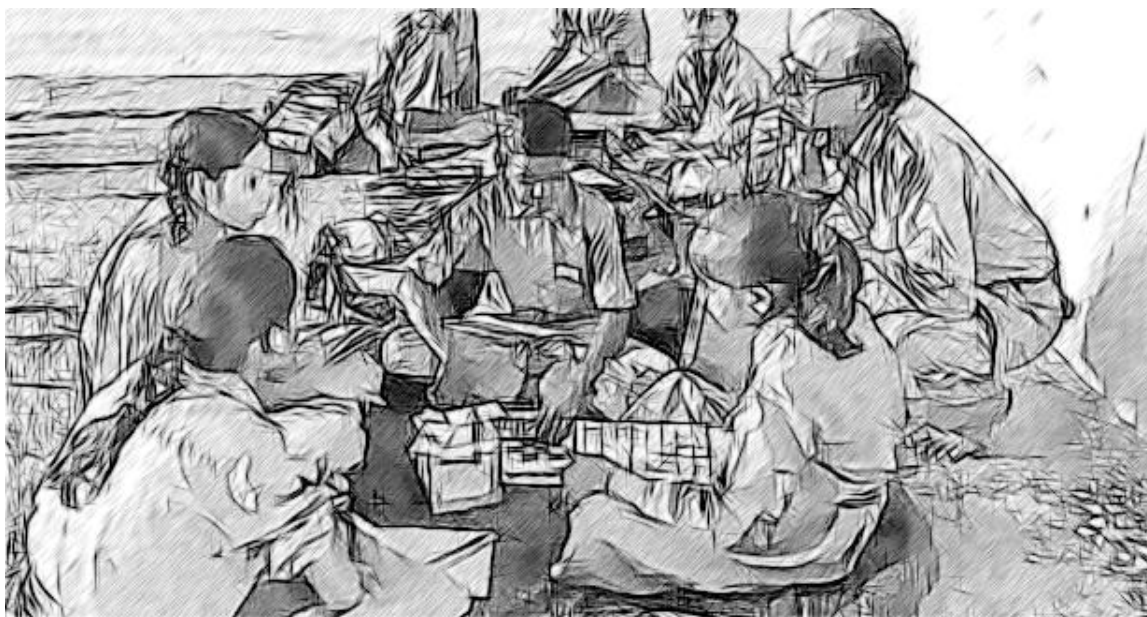
चित्र 3 छात्रों की अवधारणाओं को सुनना।

परिवर्तन के किसी भी पहलू में समस्याओं को न्यूनतम करने के लिए, कुछ विद्यालय प्रमुख अपने परिवर्तन को विद्यालय के एक क्षेत्र में प्रयोग के रूप में क्रियान्वित करते हैं और काम करने के नए तरीके आजमाते हैं, उठने वाली समस्याओं और मुद्दों का आकलन करते हैं, और उसे सारे विद्यालय में लागू करने से पहले कोई भी आवश्यक समायोजन करते हैं। इसका मतलब है कि परिवर्तन को अधिक बड़े पैमाने पर लागू करने से पहले प्रमुख कमजोरियों से निपटा जा सके।