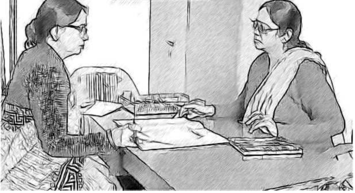
ಚಿತ್ರ 5 : ಒಂದು ಯಶಸ್ವಿ ಎಸ್.ಡಿ.ಪಿ (ಶಾಲಾ ಅಭಿವೃದ್ಧಿ ಯೋಜನೆ) ಗೆ ಸಹಯೋಗದ ಅಗತ್ಯವಿರುತ್ತದೆ.

ಗುರಿಗಳನ್ನು ಮಾತ್ರ ಮುನ್ನಡಿಸಿಕೊಂಡು ಹೋಗಬೇಕು ಹೊರತಾಗಿ ಕಾರ್ಯರೂಪದಲ್ಲಿ ಬಾರದಿರುವ ಸುಳ್ಳು ಸುದ್ದಿಗಳನ್ನು ಮಾತ್ರ ಹೊಂದಿರಬಾರದು.