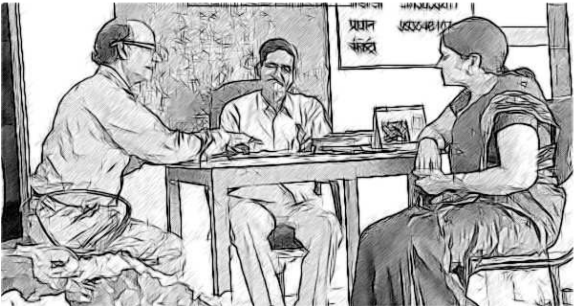
ಚಿತ್ರ 3 ಉದ್ದೇಶಗಳಿಗೆ ಕ್ರಿಯೆಯ ಅವಶ್ಯಕತೆಯಿದೆ.

ಪ್ರತಿಯೊಂದು ಕ್ರಿಯೆಗೂ ಯಾರಾದರೊಬ್ಬರು ಜವಾಬ್ದಾರಿ ತೆಗೆದುಕೊಳ್ಳುವವರನ್ನು ನೀವು ಗುರುತಿಸಬೇಕು. ಪೂರ್ಣಗೊಳಿಸಲು ಬೇಕಾಗುವ ಕಾಲವಧಿ ಮತ್ತು ಕೆಲವು ಮಾನದಂಡಗಳನ್ನು ಬಳಸಿ ಪ್ರಗತಿಯ ಮೇಲ್ವಿಚಾರಣೆಯನ್ನು ನಡೆಸಬೇಕು. ಚಟುವಟಿಕೆ 2, ನಿರ್ದಿಷ್ಟವಾಗಿ ನಿಮಗೆ ನೆರವಾಗುವುದು. ವಿಷಯಗಳನ್ನು ಪಟ್ಟಿಮಾಡಿ ಬರೆಯುವುದು ಬಹಳ ಸುಲಭ, ಅವುಗಳಲ್ಲಿ ವಿದ್ಯಾರ್ಥಿನಿಯರ ಹಾಜರಾತಿ ಸುಧಾರಣೆ ಒಂದಾಗಿರಬಹುದು, ಇದಕ್ಕೆ ಯಾರಾದರೊಬ್ಬರು ನಿರ್ದಿಷ್ಟ ಜವಾಬ್ದಾರಿಯನ್ನು ಹೊರದಿದ್ದರೆ ಯಾವೊಂದು ಕೆಲಸವಾಗುವುದಿಲ್ಲ.