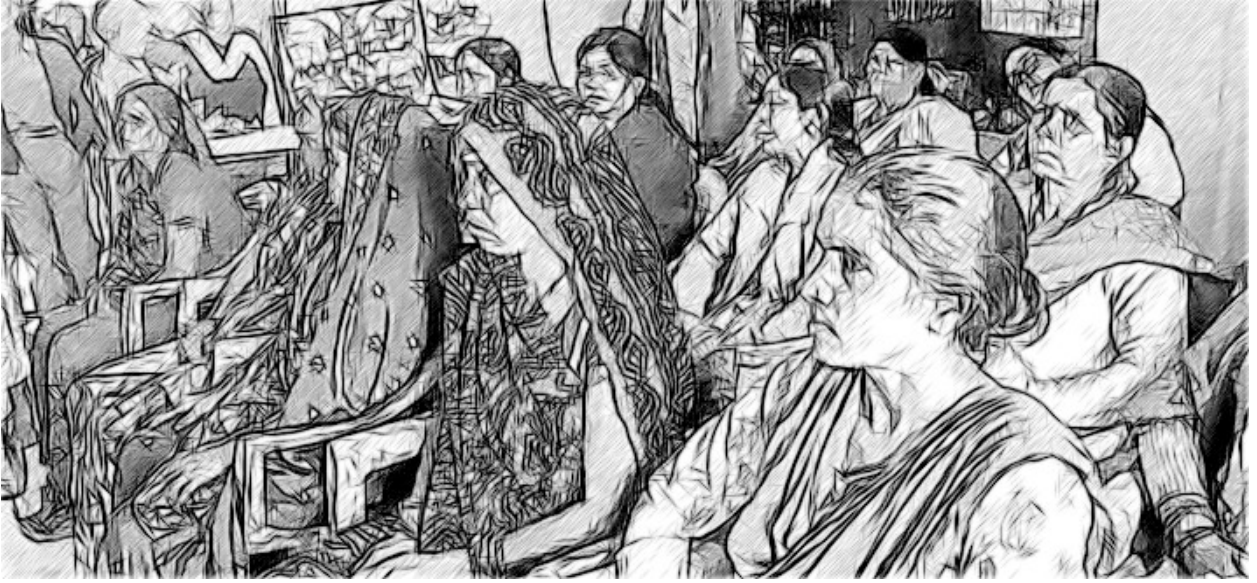
ಚಿತ್ರ 4 : ಶಾಲಾ ಆಡಳಿತ ನಮಿತಿ ಸಭೆ.