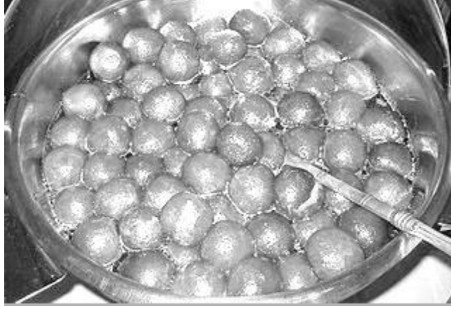
चित्र 3 गुलाब जामुन बनाना।

गतिविधि का यह भाग एक वार्तालाप गतिविधि में विकसित किए जाने के लिए उपयुक्त है। उदाहरण के लिए, आप अपनी कक्षा को समूहों में व्यवस्थित करना चाह सकते हैं, जिसमें प्रत्येक समूह अपनी मिठाई की दुकान के लिए एक नाम तय करता है और समूह-सदस्यों को भूमिकाएँ निर्दिष्ट करता है। यदि आप इस दृष्टिकोण का इस्तेमाल करना तय करते हैं तो प्रमुख संसाधन 'कहानी कहना, गाना, रोल प्ले और नाटक' से आपको मदद मिलेगी।