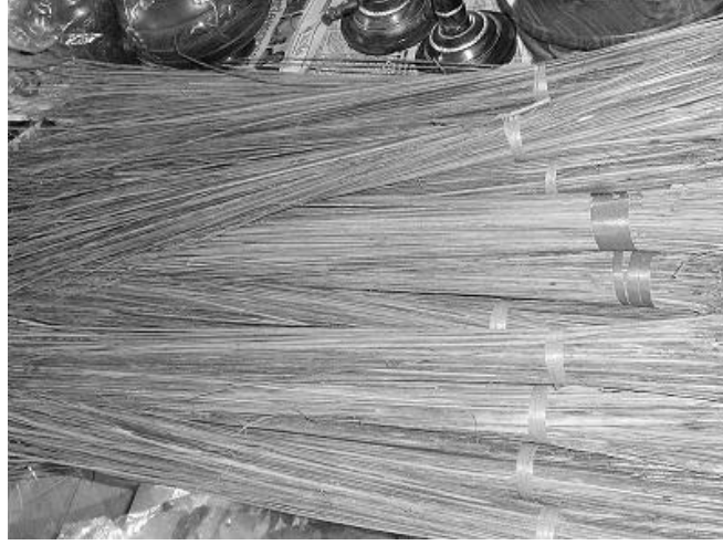
चित्र 1: नारियल की झाड़ू

पाठ के आरंभ में, प्रत्येक छात्र-छात्राओं से अपने हाथ में ली हुई छड़ी को पकड़े रहने और अपना हाथ उठाने के लिए कहें। यदि कुछ छात्र-छात्राएँ छड़ी लाना भूल गए हैं तो अन्य छात्र-छात्राओं से कहें कि वे उदारता दिखाते हुए अपनी छड़ी का कुछ हिस्सा उन छात्र-छात्राओं को बाँटे।