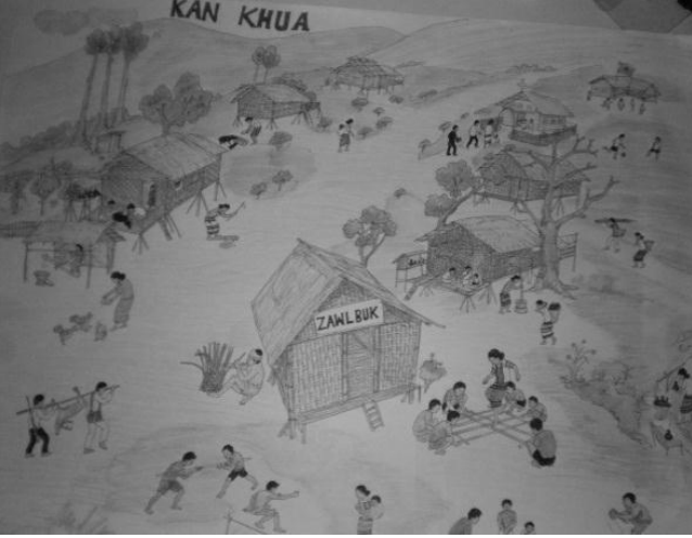
ಚಿತ್ರ 1: ನನ್ನ ಹಳ್ಳಿ

ನಾನು ನನ್ನ ವಿದ್ಯಾರ್ಥಿಗಳನ್ನು ಮಾತನಾಡುವಂತೆ ಪ್ರೋತ್ಸಾಹಿಸಲು ಚಿತ್ರಗಳನ್ನು (ಚಿತ್ರ 1 ನ್ನು ನೋಡಿ) ಬಳಸುತ್ತೇನೆ. ಸ್ಥಳೀಯ ಚಿತ್ರಕಾರರಿಂದ ರಚಿತವಾದ ಚಿತ್ರಗಳನ್ನು ಬಾಳಿಕೆ ಬರುವ ದೊಡ್ಡ ಪೇಪರ್ ಗಳ ಮೇಲೆ ಮುದ್ರಿಸಿ, ತೆಳುವಾದ ಪಾರದರ್ಶಕ ಪ್ಲಾಸ್ಟಿಕ್ ಪೇಪರ್ ನಿಂದ ಹೊದಿಸಲಾಗಿದೆ. ಮೊದಲ ಚಿತ್ರದ ಹೆಸರು 'ನನ್ನ ಹಳ್ಳಿ' ಹಾಗೂ ಎರಡನೆಯದು 'ಕೃಷಿ'.