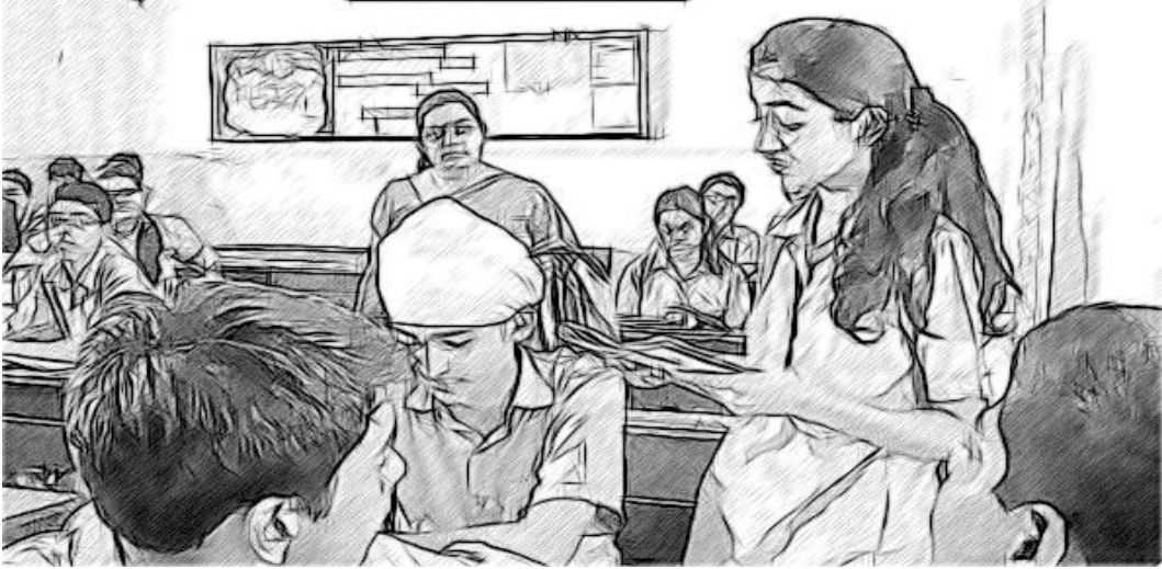
ଚିତ୍ର-୩ : କ୍ଷେତ୍ର ପରିଭ୍ରମଣର କାହାଣୀ

ଆମର ଗତବ୍ୟ ସ୍ଥଳ ଥିଲା ରେମୁଣା। ବାଲେଶ୍ୱରକୁ ଏହା ଥିଲା ଆୟମାନଙ୍କର ଦ୍ୱିତୀୟ ଓ ଶେଷ ପରିଦର୍ଶନ, ଯେଉଁଠି ଆମେମାନେ ଅଷ୍ଟମ ଶ୍ରେଣୀରେ ମଧ୍ୟ ପରିଦର୍ଶନରେ ଯାଇଥିଲୁ। ଆତ୍ମସଂଯୋଗ ଭାବେ ଆମେମାନେ ଯାହା ଏଥର କରିଥିଲୁ ତାହା ପୂର୍ବ ଅଭିଜ୍ଞତାଠାରୁ ସମ୍ପୂର୍ଣ୍ଣ ଅଲଗା ଥିଲା। ସମସ୍ତ ପ୍ରକାର ବନ୍ଦୋବସ୍ତ ବହୁତ ଭଲ ଥିଲା ଏବଂ ଆମେମାନେ ବହୁତ ଆରାମ ଅନୁଭବ କଲୁ।