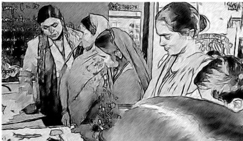
ଚିତ୍ର ୪ : ଆପଣଙ୍କ ଶିକ୍ଷାର୍ଥୀଙ୍କର ପିତାମାତାଙ୍କୁ ବ୍ୟସ୍ତ ରଖିବା ପାଇଁ ଏହା ବହୁତ ଗୁରୁତ୍ୱପୂର୍ଣ୍ଣ

ନିଜର ଚିନ୍ତାଧାରା ସମୟରେ ନିଜର ଶିକ୍ଷଣ ପୁସ୍ତିକାରେ ଲିପିବଦ୍ଧ କରି ରଖନ୍ତୁ । ଏହି ଅଧ୍ୟାୟ ଶେଷରେ ପୁଣିଥରେ ତଦାରଖ ଏବଂ ପୁନଃ ଯୋଜନା ପାଇଁ ଆପଣଙ୍କୁ ସୁଯୋଗ ମିଳିବ ।