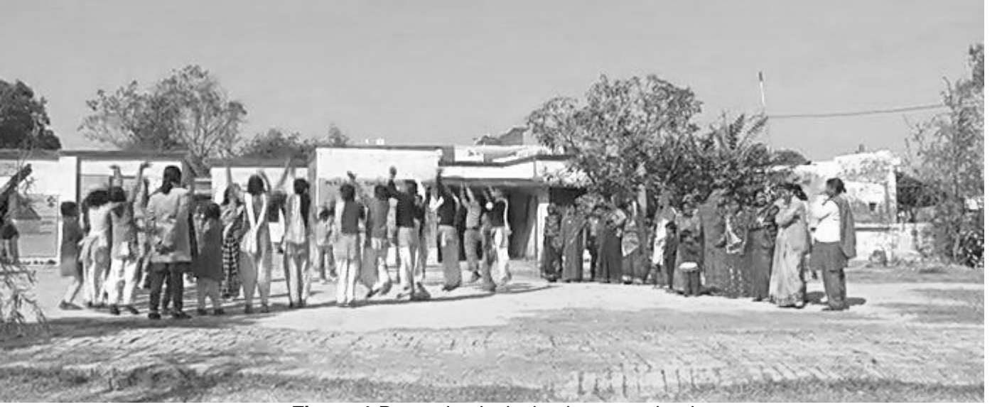
Figure 1 Promoting inclusion in your school.