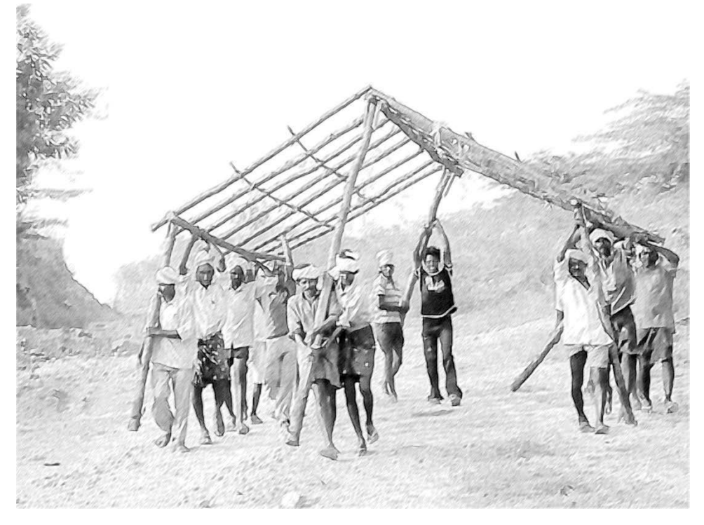
ಚಿತ್ರ 1 ಕೋನಗಳು ಎಲ್ಲೆಡೆ ಇವೆ.

ನೀವು ಸುತ್ತ-ಮುತ್ತ ನೋಡಿದಾಗ, ಎಲ್ಲೆಡೆ ಕೋನಗಳನ್ನು ಗಮನಿಸಬಹುದಾಗಿದೆ. ಕೋನಗಳಿಲ್ಲದ ಜೀವನ ಸಾಧ್ಯವೆನಿಸುವುದಿಲ್ಲ. ಕೋನಗಳನ್ನು ವಸ್ತುಗಳಲ್ಲಿ, ಕಟ್ಟಡಗಳಲ್ಲಿ, ಬೆಟ್ಟಗಳಲ್ಲಿ, ಮರಗಳಲ್ಲಿ, ಸಮುದ್ರದ ಅಲೆಗಳಲ್ಲಿ, ಮನುಷ್ಯರಲ್ಲಿಯೂ , ನಮ್ಮ ಕೈ-ಕಾಲುಗಳ ಚಲನೆಯಲ್ಲಿ ಕಾಣುತ್ತೇವೆ (ಚಿತ್ರ 1).