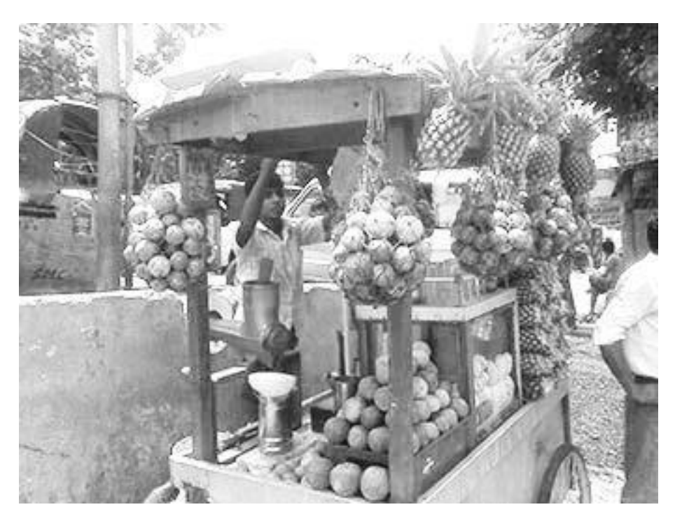
ಚಿತ್ರ 1 ಹಣ್ಣಿನ ರಸ ಮಾರುವವನು

ಒಂದೇ ಪ್ರಮಾಣವನ್ನು ಹಲವಾರು ಬಾರಿ ಅಂದಾಜು ಮಾಡಲು ಪ್ರಯತ್ನಿಸಿದಾಗ ನಮ್ಮ ಅಂದಾಜುಗಳು ಉತ್ತಮಗೊಳ್ಳುತ್ತವೆ. ಉದಾ: ಹಣ್ಣಿನ ರಸ ಮಾರುವ ವ್ಯಕ್ತಿ ತನ್ನ ಅನುಭವದಿಂದ 5 ಲೋಟ ರಸ ಪಡೆಯಲು ಎಷ್ಟು ಕಿತ್ತಳೆ ಹಣ್ಣುಗಳ ಅಗತ್ಯವಿದೆ ಎಂದು ಅಂದಾಜಿಸಬಲ್ಲ.