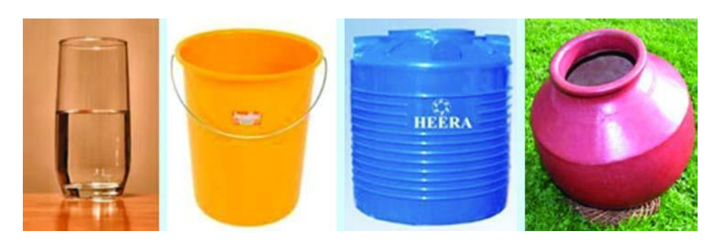
ಚಿತ್ರ 5 ದ್ರವವನ್ನು ಹಿಡಿದಿಟ್ಟುಕೊಳ್ಳಬಹುದಾದ ವಸ್ತುಗಳ ನಾಲ್ಕು ಉದಾಹರಣೆಗಳು

1. ಾತ್ರವನ್ನು ಅಂದಾಜಿಸುವುದು : ದ್ರವವನ್ನು ಸಂಗ್ರಹಿಸಬಹುದಾದ ಬೇರೆ ಬೇರೆ ಗಾತ್ರದ 3 ವಸ್ತುಗಳನ್ನು ಆಯ್ಕೆ ಮಾಡಿಕೊಳ್ಳಿ (ಚಿತ್ರ 5 ರಲ್ಲಿ ಕೆಲವು ಉದಾಹರಣೆಗಳನ್ನು ನೀಡಿದೆ.) ಅವುಗಳಲ್ಲಿ ತುಂಬಬಹುದಾದ ನೀರಿನ ಗಾತ್ರವನ್ನು ಹೇಗೆ ಅಂದಾಜು ಮಾಡುವಿರಿ?