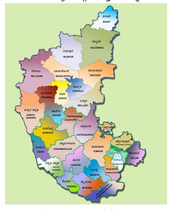
ಚಿತ್ರ 4 ಕರ್ನಾಟಕದ ಜಿಲ್ಲೆಗಳು.

1. ವಿಸ್ತೀರ್ಣವನ್ನು ಅಂದಾಜಿಸುವುದು: ಕರ್ನಾಟಕದ ಪ್ರತಿ ಜಿಲ್ಲೆಯ ವಿಸ್ತೀರ್ಣವನ್ನು ಅಂದಾಜಿಸುವ ವಿಧಾನ ಕಂಡುಹಿಡಿಯಿರಿ.