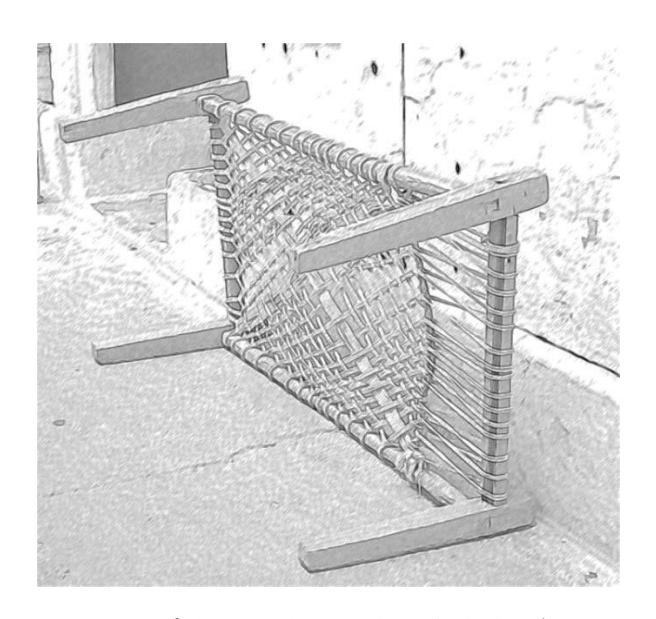
ಚಿತ್ರ 2 ಒಂದು ಸಾಂಪ್ರದಾಯಿಕ ಮಂಚ

ಹೆಚ್ಚಿನ ವಿದ್ಯಾರ್ಥಿಗಳು ಉತ್ತರ ಪಡೆಯಲು ಪ್ರಯತ್ನಿಸುವಾಗ, ಅವರನ್ನು ಹೀಗೆ ಪ್ರಶ್ನಿಸಿ: