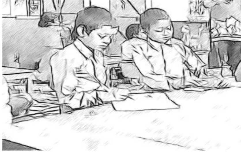
চিত্র ৩ : পত্ৰ লিখন

যেতিয়া তেওঁলোকৰ লিখা হ'ল তেতিয়া মই প্ৰতিটো দলকেই শ্ৰেণীৰ সকলোকে লিখা কথাখিনি জনাবলৈ দিলোঁ। তেওঁলোকে এনে কৰাৰ পাছত মই কৃষ্ণফলকৰ তেওঁলোকৰ ধাৰণাবোৰ লিখি দিছিলোঁ। কেতিয়াবা তেওঁলোকৰ ভাষাৰ মাজেদি খং প্ৰকাশ পাইছিল। সেইবাবে মই তেওঁলোকক তেওঁলোকৰ লিখিবোৰ বিনম্ৰভাৱে লিখাৰ গুৰুত্বটো বুজাই দিছিলোঁ লগতে এই কাৰণবোৰক দৃঢ়ভাৱে দেখুৱাবলৈ আৰু যদি তেওঁলোকে উপায়ুক্ত ক মনোযোগ দিয়াটো বিচাৰে তেনেহ'লে কিছুমান ভাল যুক্তিৰ প্ৰয়োজন বুলি কৈছিলোঁ। একেলগে আমি ব্লেকব'ৰ্ডত চিঠিখনৰ কথাবোৰ মোলায়েম বা শুৱলা হোৱালৈকে কেইবাবাৰো লিখিছিলোঁ।