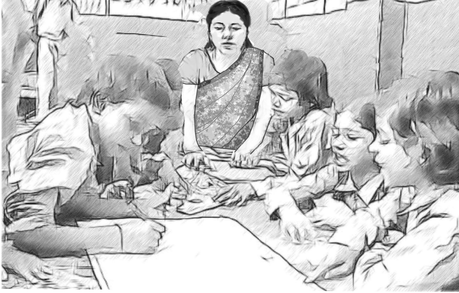
চিত্ৰ ২ : এটা দলে মিলি কাহিনীৰ কাম কৰি আছে

যেতিয়া প্ৰত্যেকৰে কোৱা শেষ হয় তেতিয়া মই তেওঁলোকক তেওঁলোকে কোৱা কথাখিনিৰ শব্দবোৰ দেখুৱাই দি পঢ়ি শুনাও। তাৰপাছত বাক্যবোৰ আমি পুনৰ চাওঁ আৰু নতুনকৈ সাজি একোটা কাহিনী তৈয়াৰ কৰোঁ। আমি সকলোৱে কাহিনীটো একেলগে ডাঙৰকৈ পঢ়োঁ আৰু নতুনকৈ নতুন শব্দ আৰু খণ্ডবাক্য সংযোগ কৰি সাৱলীল আৰু মনোগ্ৰাহী কৰোঁ। যেতিয়া সকলোৱে কাহিনীটো শুনি আনন্দ পায় তেতিয়া আমাৰ সকলোৰে সন্মত কাহিনীটোৰ এটা নাম দিওঁ।