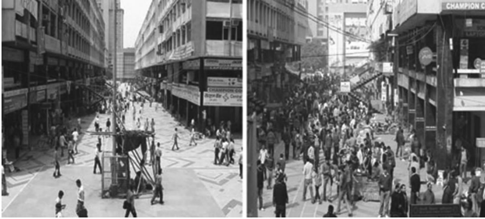
চিত্র 1 বাস্তব জীবনে গতিশীলতা: নেহরু প্লেস, দিল্লী যখন শান্ত (বাঁদিকে) এবং ব্যস্ত (ডানদিকে)

এশিয়ার কম্পিউটার এবং সম্পর্কিত সরঞ্জামের বৃহত্তম বাজার, দিল্লীর নেহরু প্লেস সর্বদা ভিড়ে ভরা থাকে। কাজের সময়ে সেখানকার পরিবেশ অত্যন্ত কর্মচঞ্চল থাকে। সবকিছুই ফেরিওয়ালা থেকে গাড়ি পার্ক করার জায়গা বা কোনও দোকানে প্রয়োজনীয় কর্মীর সংখ্যা সবই সকাল থেকে সন্ধ্যা অবধি দ্রুত পরিবেশের পরিবর্তন দ্বারা প্রভাবিত হয় (চিত্র 1)। পরিবেশের এই পরিবর্তনটিকে গতিশীলতা (dynamics) বলা হয়।