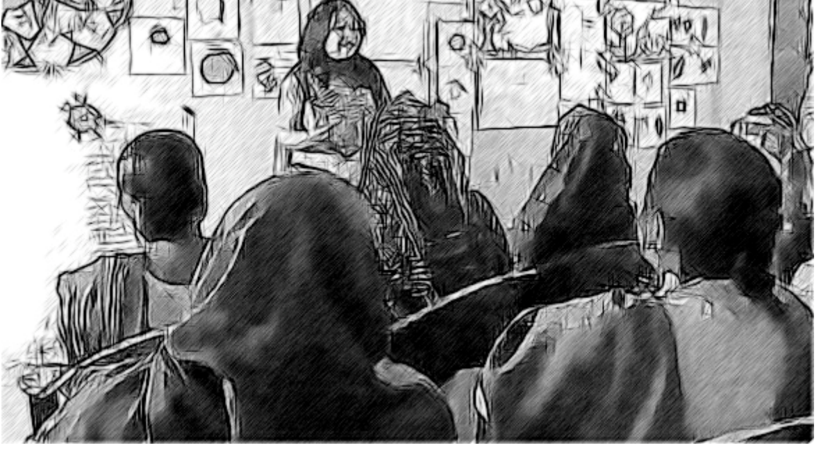
চিত্ৰ ১ : ছাত্ৰ-ছাত্ৰীৰ শিকনৰ কৌশল সমূহৰ বিকাশ কৰা হৈছে।

যদিহে একেই সমস্যা আপোনাৰ বিদ্যালয়ত সন্মুখীন হোৱা নাই, ইয়াত মূল্য দি, কিছুমান প্ৰত্যাহ্বান বিষয়ে ভবা উচিত যিবোৰ আপোনাৰ সহকৰ্মী আৰু ছাত্ৰ-ছাত্ৰীসফল সন্মুখীন হ'ব পাৰে আৰু এখন বিদ্যালয়ৰ প্ৰধান হিচাপে, সেইবোৰ উপশম কৰিবলৈ আৰু ছাত্ৰ-ছাত্ৰীৰ শিকনৰ বিকাশৰ বাবে কিছু কৌশল প্ৰয়োদ কৰিব পাৰে, আপুনি এই বিষয়েও চিন্তা কৰা উচিত, এইবোৰৰ পৰিবৰ্তনত কেনেকৈ আপুনি কাৰ্য্যৰম্ভ কৰিব, আৰু কেনেকৈ আপুনি সহকৰ্মী, ছাত্ৰ-ছাত্ৰীসকল আৰু সমাজৰ সৈতে কাম কৰিব, নিশ্চিত হওঁক যে যিটোকে আপুনি স্থানত ৰাখে সেইটো বৰ্তি থাকে আৰু আপোনাৰ ছাত্ৰ-ছাত্ৰীসকলৰ শিকন আৰু জীৱনৰ ওপৰত সঠিক প্ৰভাৱ পৰে।