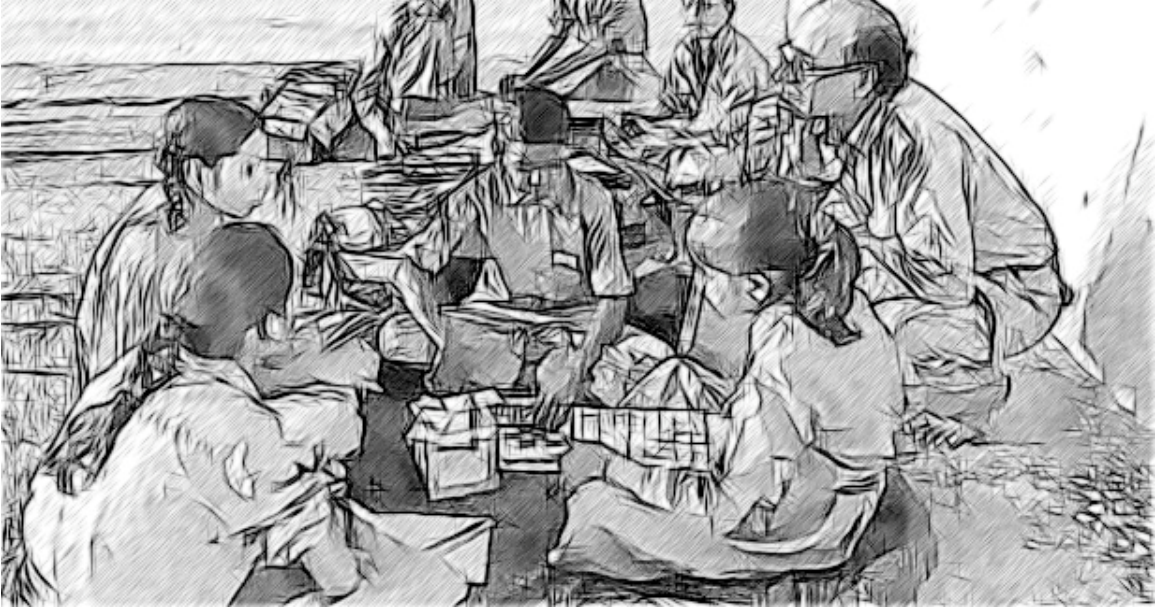
চিত্র- ৩ ছাত্র-ছাত্রীৰ ধাৰণা বোৰ শুনক।

যিকোনো পৰিবৰ্তন আৰম্ভ কৰোতে সমস্যাবোৰ কম কৰাৰ বাবে, বিদ্যালয়প কিছু প্রধান সকলে এটা ক্ষেত্ৰত তেখেত সকলৰ বিদ্যালয়ৰ পৰিবৰ্তনৰ কামৰ বাবে নতুন পথৰ পৰীক্ষামূলক আঁচনিৰ চেষ্টা কৰে। সমস্যাবোৰ নিৰূপণ কৰা আৰু যিবোৰ পৰিণাম জাগ্ৰত হয়, আৰু যিকোনা প্ৰয়োজনীয় কাৰ্য সম্পূৰ্ণ বিদ্যালয়ৰ মাজেদি বিস্তৃত কৰাৰ আগতে প্ৰয়োজনীয় সমন্বয় সছাপন কৰিব লাগে। ইয়াৰ মানে হ'ল যে পৰিবৰ্তন ডাঙৰ অনুপাতত আৰম্ভ কৰাৰ আগতে যিকোনো গুৰুত্ব পূৰ্ণ দুৰ্বলতা সমূহ বাচি উলিয়াব লাগিব।