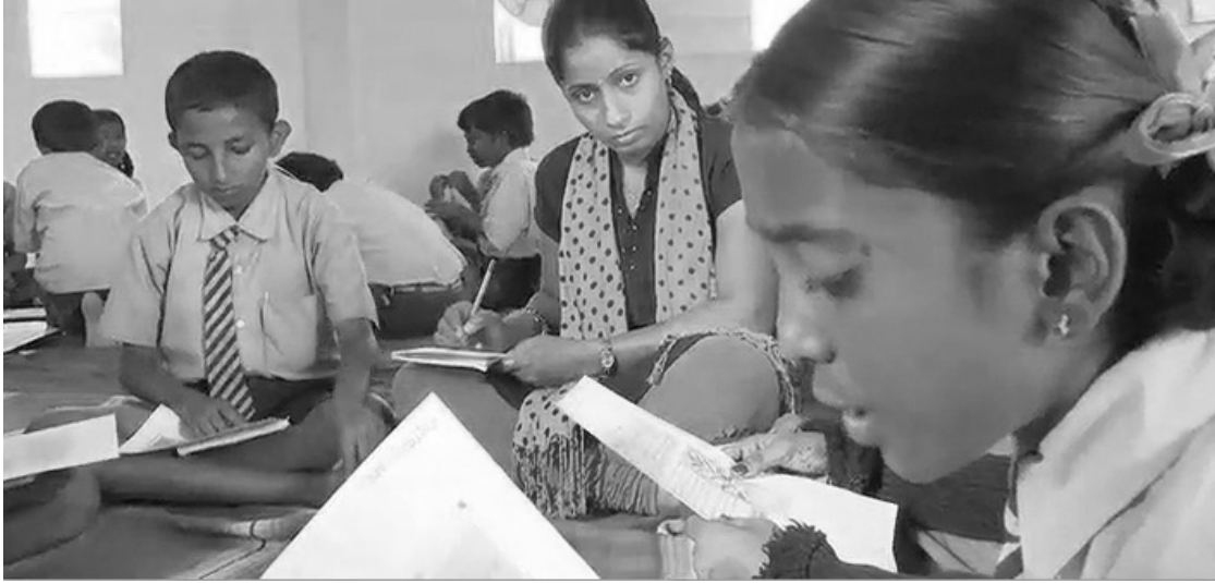
अंग्रेजी सीखने वाले छात्रों को सुनना, अवलोकन करना और उनका आंकलन करना।

यदि आप, केवल भाषा के पाठों में ही नहीं विद्यालय के अन्य समयों में भी, अपने छात्रों को अंग्रेजी का अभ्यास करने का पर्याप्त अवसर देते हैं तो आपको उन्हें सुनने, अवलोकन करने व आंकलन करने के अधिक अवसर मिलेंगे। यदि छात्र केवल पाठ्यपुस्तक के पाठ से ही अंग्रेजी सुनते या लिखते हैं, तो उनकी प्रगति धीमी रहेगी और आपके पास उनका मूल्यांकन करने के अवसर कम रहेंगे। अगली गतिविधि में आप छात्रों के लिए अपनी भाषा की पाठ्यपुस्तक की संभावना का विस्तार करेंगे। आपके लिए यह स्वयं की अंग्रेजी का अभ्यास करने और इसे सुधारने का एक मौका भी है।