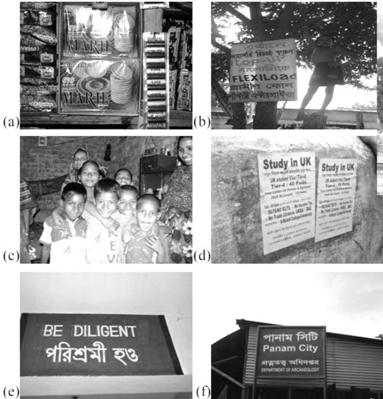
चित्र 1 समुदाय में अंग्रेजी के उदाहरण: (a) पैकेजिंग पर; (b) मोबाइल फोन सेवाओं के एक विज्ञापन में; (c) बच्चों की टी-शर्टों पर; (d) गाँव की दीवार पर लगे एक विज्ञापन में (e) स्कूल में द्विभाषी साइनबोर्ड पर; (f) सड़क किनारे लगे साइनबोर्ड पर।

अपनी सूची बना लेने के बाद, इसकी समीक्षा करें और इस बारे में सोचें कि क्या आपके छात्रों की भी इन स्थानों पर अंग्रेजी से संपर्क होने की संभावना है। क्या वे इस भाषा से परिचित होंगे? आप अपने भाषा पाठों में जो शब्द और वाक्यांश सिखाते हैं, क्या उनमें से कुछ स्थानीय पर्यावरण में भी मौजूद हैं? आपने जो उदाहरण इकट्ठे किए हैं, क्या आप उनमें से कुछ का उपयोग कक्षा में कर सकते हैं?