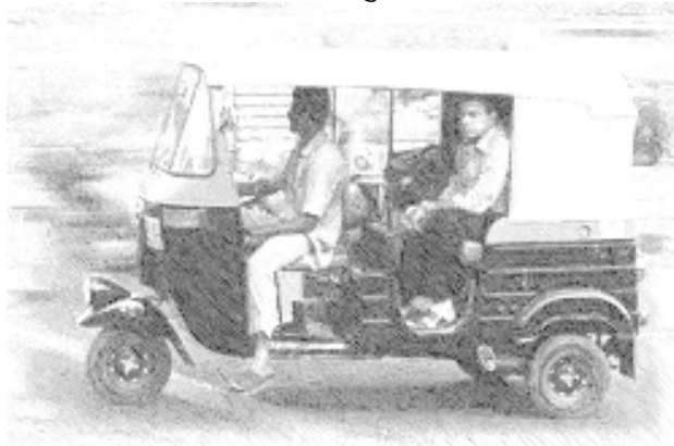
चित्र 1 ऑटोरिक्शा चालक और यात्री।

फिर उन्हें अपने विचारों को सारी कक्षा के साथ बांटने को कहें। यह निम्न रूप से व्यवस्थित किया जा सकता है: