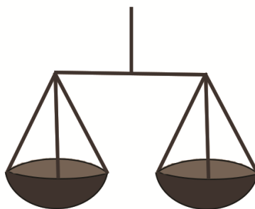
चित्र 1 बराबर का चिह्न संतुलन दर्शाता है।

बराबर का चिह्न हमेशा दो व्यंजकों के बीच के रिश्ते को दर्शाता है। बराबर का चिह्न मात्रात्मक समानता दर्शाता है। दूसरे शब्दों में, बराबर चिह्न की बाईं ओर का व्यंजक वही मात्रा दर्शाता है जो दाईं ओर वाला व्यंजक दर्शाता है। बराबर के चिह्न को 'के समान है' या 'के समतुल्य है' या 'समान मूल्य का है' के रूप में पढ़ा जा सकता है। यह समझने पर समीकरणों के साथ कार्य करते समय आपके विद्यार्थियों को मदद प्राप्त होगी।