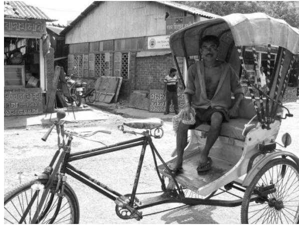
आकृति 2 एक रिक्शा : ऐसी वस्तु का उदाहरण जो कि चलती है।

तस्वीर तक, हर प्रकार की चीजों का एक मिश्रण था। संकलन में छोटी और बड़ी, भारी और हल्की वस्तुएं शामिल थीं।