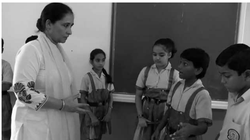
आकृति 3 विद्यार्थी जब काम कर रहे होते हैं, तो शिक्षक का उन्हें ध्यानपूर्वक सुनना।

ध्यानपूर्वक सुनने से आप न केवल उस उत्तर पर गौर करने में समर्थ होते हैं, जिसकी आप अपेक्षा कर रहे होते हैं, बल्कि इससे आप असाधारण या नवाचार उत्तरों के प्रति सतर्क भी होते हैं, जिसकी हो सकता है कि आपको अपेक्षा न रही हो। इस तरह के उत्तर गलतफहमियों को चिह्नित कर सकते हैं, जिन्हें ठीक करने की जरूरत होती है अथवा वे एक नयी स्थिति को प्रदर्शित कर सकते हैं, जिन पर आपने विचार नहीं किया हो। उदाहरण के लिए, इनके प्रति आपकी प्रतिक्रिया 'मैंने तो यह सोचा ही नहीं था। आप इस तरह से क्यों सोचते हैं? इसके बारे में मुझे और बतायें' ये सब क्रिया प्रेरणा को बनाये रखने में बहुत महत्वपूर्ण हो सकते हैं।