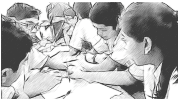
चित्र 1 छोटे समूहों में कार्य कर रहे विद्यार्थी।