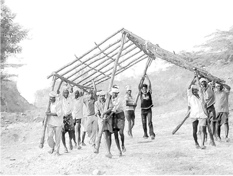
चित्र 1 कोण सभी जगह हैं

जब आप आस-पास देखते हैं, तो आपको चारों ओर कोण दिखाई देंगे। बिना कोणों के जीवन संभव नहीं लगता। वस्तुओं, इमारतों, पहाड़ों, पेड़ों, समुद्र की लहरों - यहाँ तक कि लोगों में भी, हमारे हाथों व पैरों के चलने में कोण हैं (चित्र 1)।