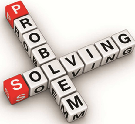
चित्र 1 समस्या का समाधान करना।

शब्द समस्याओं को 'पढ़ने' के लिए जानकारी को 'डिकोड' करना होता है, ताकि समझा जा सके कि गणितीय प्रतिरूप क्या है और इसलिए समाधान प्रदान करने के लिए किन विचारों की आवश्यकता है। कुछ शब्द समस्याओं में अप्रासंगिक जानकारी होती है और कुछ में नहीं। अपने विद्यार्थियों के मस्तिष्क को इस बात के लिए प्रशिक्षित करना ज़रूरी है कि वे किसी शब्द समस्या में गणितीय जानकारी की प्रासंगिकता (या प्रासंगिकता के स्तर) को पहचान सकें।