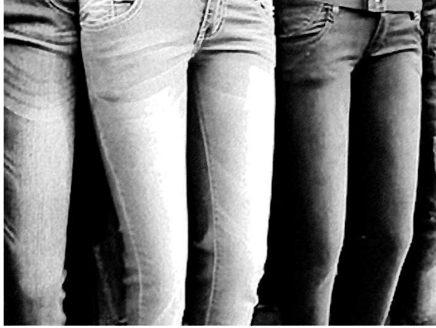
चित्र 2 दुकान में सजे हुए जीन्स।