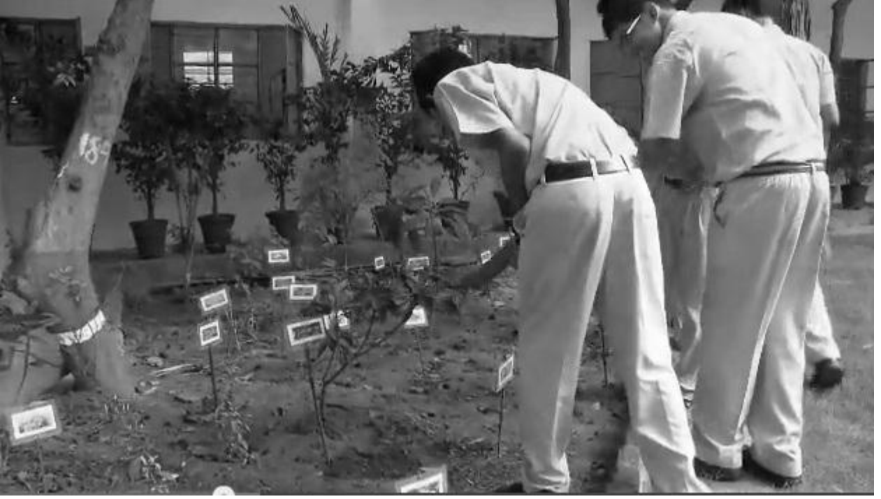
चित्र 1 यह अध्यापिका अपनी कक्षा के विद्यार्थियों को पत्तियां एकत्र करने के लिए स्कूल के मैदान में ले गई है। वे पत्तियों को अपनी कक्षा में ले जाएंगे और हाथों में पकड़े जाने वाले लेंस और सूक्ष्मदर्शियों से उनका अध्ययन करेंगे (पाठ्य पुस्तिका में गतिविधि 6.3)।