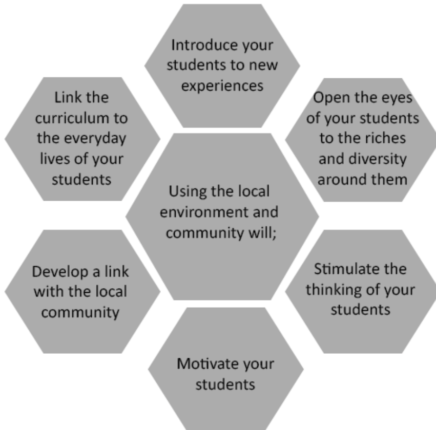
चित्र 2 स्थानीय समुदाय और पर्यावरण संसाधनों का प्रयोग करने के लाभ

आपका स्थानीय समुदाय और पर्यावरण एक सरल एवं महत्वपूर्ण संसाधन के रूप में उपलब्ध है। आपके स्थानीय समुदाय में, ऐसे लोग होते हैं जिन्हें विज्ञान के अनेक विषयों में विशेषज्ञता हासिल होती है। आपके स्थानीय पर्यावरण में भी आपकी अनेक प्राकृतिक संसाधनों तक पहुँच होती है। चित्र 2 में इन संसाधनों का प्रयोग करने के लाभों का वर्णन किया गया है।