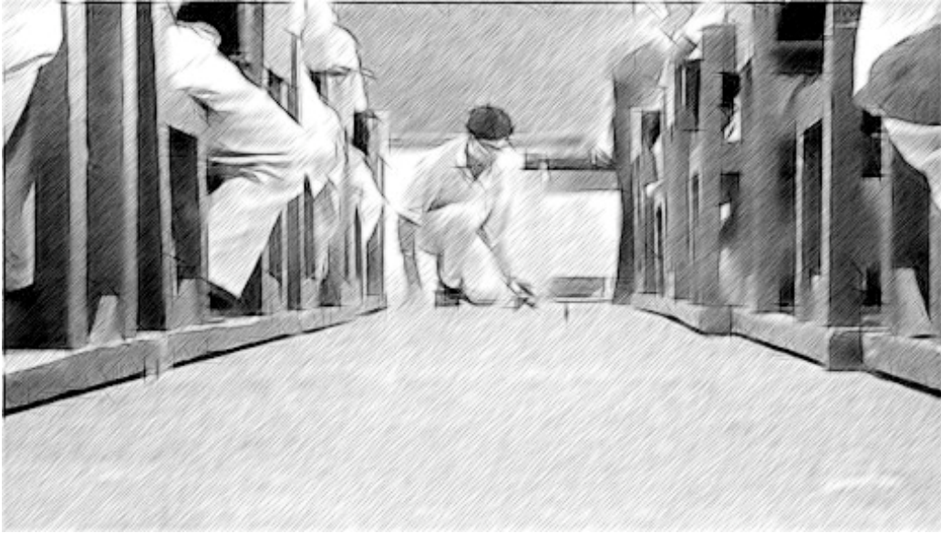
चित्र 2 एक सरल प्रश्न का उदाहरण एक उपयुक्त संकेत हो सकता है। उदाहरण के लिए: आप रोलर स्केट को घूमने से कैसे रोक सकते हैं?

ऐसा संकेत चुनना महत्वपूर्ण होता है जिससे अनेक विचारों की उत्पत्ति होगी, इसलिए यहां पर खुला प्रश्न होना चाहिए या कोई ऐसी समस्या जिसका कोई एक सही उत्तर न हो।