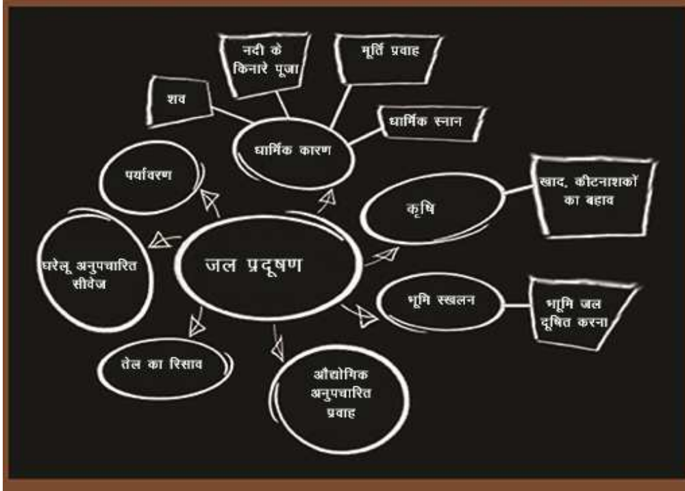
चित्र 2 नदी को क्या प्रदूषित करता है इस पर ब्लैकबोर्ड पर लिखे नोट्स।

जब उन्होंने अपने विचारों को व्यक्त किया तो मैंने समूहों की प्रशंसा की और उनके विचारों को ब्लैकबोर्ड पर लिखकर उन्हें बताया कि अवधारणाओं को कैसे समूहों में बाँटा जाता है और आपस में एक, दूसरे से जोड़ा जाता है [चित्र 2]। कभी-कभी विचारों को किस वर्ग में डालें यह तय करने पर ही एक चर्चा शुरू हो जाती जैसे कि पुराने इंजन के तेल को नदी में डालना औद्योगिक प्रवाह हुआ या घरेलू अपशिष्ट।