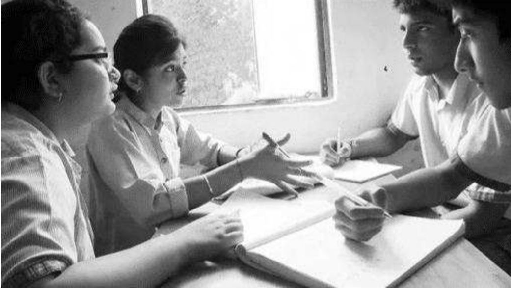
चित्र 1 साझा प्रोजेक्ट पर काम करते हुए विद्यार्थी

यदि, आपके विद्यार्थियों के लिये नया नहीं हो मिश्रितलिंगी समूह समलिंगी समूहों की तुलना में बेहतर होते हैं। मिश्रित क्षमता के समूहों के लिये भी यह सच है। सहयोग नहीं करने वाले विद्यार्थियों को एक ही समूह में न रहें। आप इस पर भी विचार कर सकते हैं कि विद्यार्थी रहते कहाँ हैं। यदि आप अपने विद्यार्थियों से अपेक्षा कर रहे हों कि वे स्कूल के बाहर भी प्रोजेक्ट पर काम करेंगे, तो पास-पास रहने वाले विद्यार्थियों को एक समूह में रखना मददगार होगा। आपको सुनिश्चित करना होगा कि जिन विद्यार्थियों को पढ़ने या लिखने में कठिनाई आती है उन्हें इन कौशलों में निपुण विद्यार्थियों के समूह में रखें। सर्वोत्तम समूह वह होगा जिसमें विद्यार्थियों के कौशल आपस में पूरक हों और जहाँ पर विद्यार्थी एक दूसरे की सहायता करते हों। पाठ से पहले ही आप समूह बना लें और फिर समूह के नामों को पढ़कर सुनाएं या कक्षा की दीवार, नोटिस बोर्ड पर समूहों की सूची लगा दें।