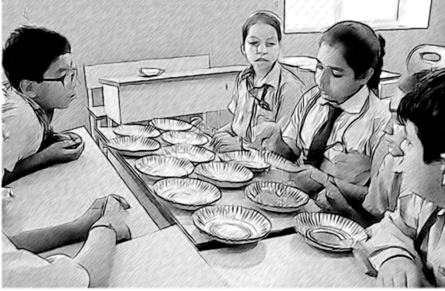
चित्र 1 विद्यार्थियों का एक समूह भिन्न सीखने के लिए प्लेटों का उपयोग करते हुए।

अब उन समस्याओं पर जाएं जो इन दो विचारों को मिलाती है।