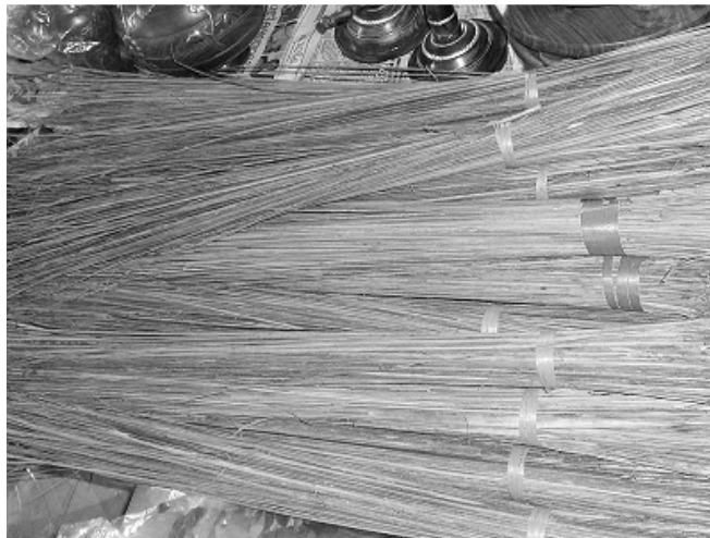
चित्र 1 नारियल की झाड़ू।

पाठ के आरंभ में, प्रत्येक विद्यार्थी से अपने हाथ में ली हुई छड़ी को पकड़े रहने और अपना हाथ उठाने के लिए कहें। यदि कुछ विद्यार्थी छड़ी लाना भूल गए हैं तो अन्य विद्यार्थियों से कहें कि वे उदारता दिखाते हुए अपनी छड़ी का कुछ हिस्सा उन विद्यार्थियों से बांटे।