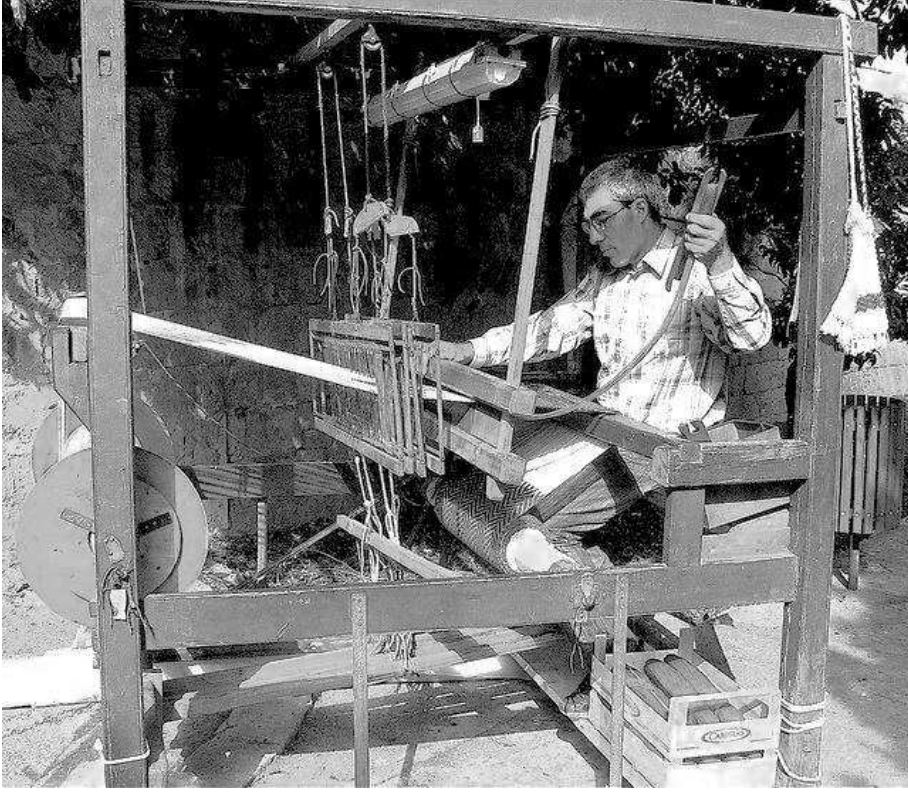
चित्र 2 एक बुनकर।