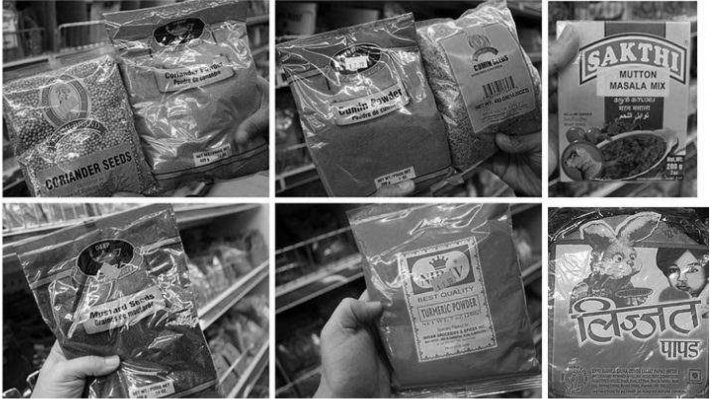
चित्र 1 फुड पैकेजिंग पर लेखन के उदाहरण।

मैंने कक्षा में पैकेजिंग ले आया और अपने विद्यार्थियों को दिखाने के लिए उनमें से एक का चयन किया। यह एक मैंगो ड्रिंक का कार्टन था। मेरे कई विद्यार्थियों ने उसे पहचान लिया, क्योंकि वे स्वयं उसे पीते थे।