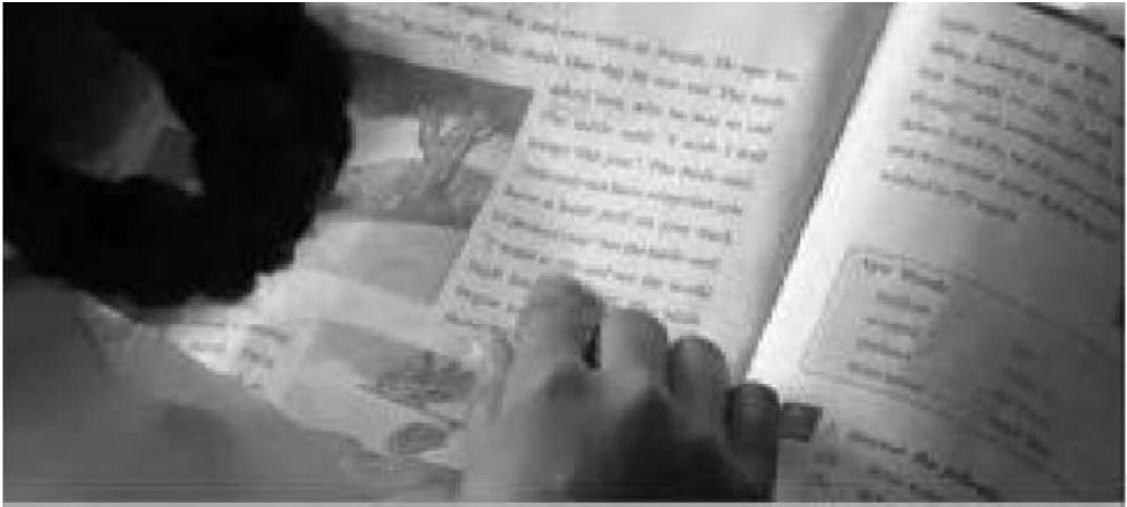
ଚିତ୍ର ୧ : ଗୁରୁତ୍ୱପୂର୍ଣ୍ଣ ଓ କ୍ଲାସ୍ ଶବ୍ଦଗୁଡ଼ିକ ତଳେ ଆଙ୍ଗୁଳି ଦେଖାଇ ପଢ଼ିଲେ, ଶିକ୍ଷାର୍ଥୀମାନେ ଜାଣିପାରିବେ ଯେ ଏହି ଲେଖାର କିଛି ଅର୍ଥ ଅଛି।

ଶିକ୍ଷାର୍ଥୀମାନଙ୍କ ପାଇଁ ଉଚ୍ଚ ପଠନ କଲାବେଳେ ଗୁରୁତ୍ୱପୂର୍ଣ୍ଣ ଓ କ୍ଲାସ୍ ଶବ୍ଦଗୁଡ଼ିକ ତଳେ ଆଙ୍ଗୁଳି ଦେଖାଇ ପଢ଼ନ୍ତୁ। ସେମାନେ ଜାଣି ପାରିବେ ଯେ ଏହି ଲେଖାର ଗୋଟିଏ ଅର୍ଥ ଅଛି। ଏହା ଦ୍ୱାରା ବହି କିପରି ଧରାଯାଏ, କିପରି ପୃଷ୍ଠା ଓଲଟା ଯାଏ, କିପରି ବାମରୁ ଡାହାଣକୁ ପଢ଼ାଯାଏ ଏବଂ କିପରି ଉପରୁ ତଳକୁ ପଢ଼ାଯାଏ, ଶିକ୍ଷାର୍ଥୀମାନେ ଜାଣି ପାରିବେ।