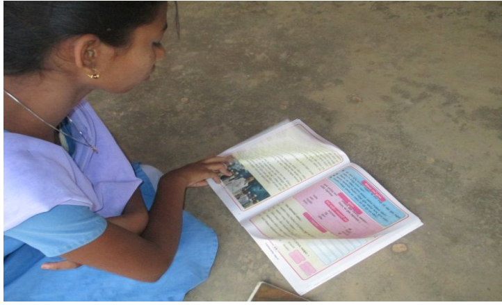
ଚିତ୍ର ୧ ଆପଣଙ୍କ ପଢ଼ି ଶିଖିବାର ସ୍ମୃତି ସମୂହ

ସାଥୀ ଶିକ୍ଷକମାନଙ୍କ ସହ ନିଜର ଅନୁଭୂତି ବିନିମୟ କରନ୍ତୁ । ସେମାନଙ୍କ ଅଭିଜ୍ଞତା ସହ ଆପଣଙ୍କ ଅଭିଜ୍ଞତାର କ’ଣ ସାମଞ୍ଜସ୍ୟ ଓ ପ୍ରଭେଦ ରହିଛି ଦେଖନ୍ତୁ ।