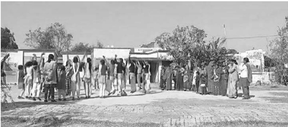
ଚିତ୍ର ୧ : ଆପଣଙ୍କ ବିଦ୍ୟାଳୟରେ ଅନ୍ତର୍ନିବେଶୀ ମନୋବୃତ୍ତିକୁ ପ୍ରୋତ୍ସାହିତ କରିବା

ଜଣେ ବିଦ୍ୟାଳୟ ମୁଖ୍ୟ ଭାବରେ ଏହା ଆପଣଙ୍କର ଦାୟିତ୍ୱ ହେଉଛି ଯେ ଆପଣ ଆପଣଙ୍କର ବିଦ୍ୟାଳୟ ଓ ଗୋଷ୍ଠୀରେ ଏହିପରି ଅନ୍ତର୍ନିବେଶୀ ମନୋବୃତ୍ତି ଏବଂ ଆଚରଣକୁ ଆଗେଇ ନେଇ ପ୍ରୋତ୍ସାହିତ ତଥା ପରିବର୍ତ୍ତନ କରିପାରିବେ ।