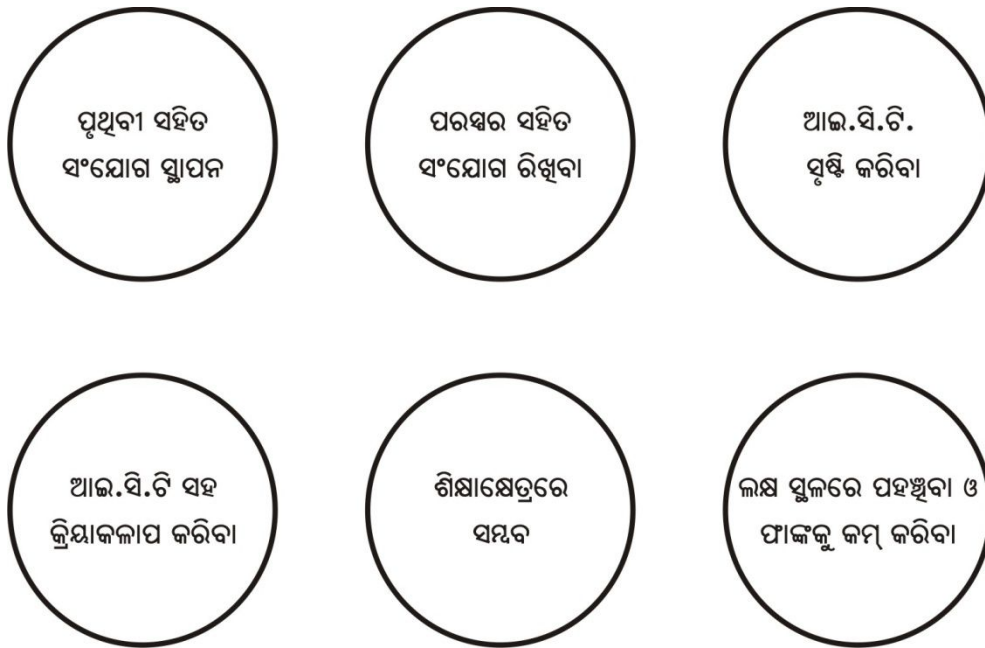
ଚିତ୍ର ୪ ଆଜି ଓ ଆସନ୍ତାକାଳି ପ୍ରଯୁକ୍ତିବିଦ୍ୟାର ଛଅଟି ଖୁଅ ।

ଶିକ୍ଷକ, ଶିକ୍ଷାର୍ଥୀଙ୍କୁ ଆଜିକାଲିର ପ୍ରଯୁକ୍ତିବିଦ୍ୟାକୁ ପରିଚାଳନା କରିବାର ସାମର୍ଥ୍ୟ ବିକାଶ କରିବା ପାଇଁ ଆଇସିଟି (ICT) ପାଠ୍ୟକ୍ରମରେ ୬ଟି ସ୍ତର ଚିହ୍ନଟ କରାଯାଇଛି । ସେହି ସ୍ତରଗୁଡ଼ିକୁ ନିମ୍ନରେ ପ୍ରଦତ୍ତ କରାଗଲା ।