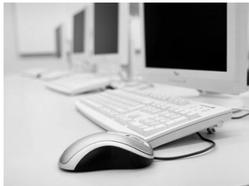
ଚିତ୍ର : ୨ ଇଣ୍ଟରନେଟକୁ ଯାଇପାରିବେ ।