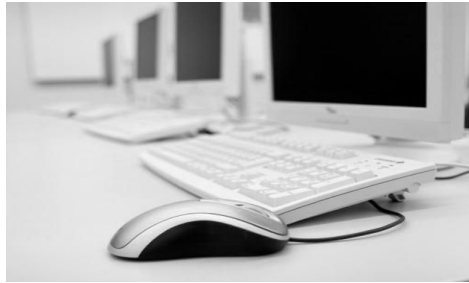
ଚିତ୍ର ୧ ହାର୍ଡୱେର ଆପଣଙ୍କ ବିଦ୍ୟାଳୟକୁ ଉପକାର କରିପାରେ ।

ପ୍ରଯୁକ୍ତିବିଦ୍ୟାର ପରିସରରେ ବିଭିନ୍ନ ଉପକରଣ ଅନ୍ତର୍ଭୁକ୍ତ ଅଟେ ଯଥା ଡେସ୍କଟପ୍ କମ୍ପ୍ୟୁଟର, ଲାପ୍ଟପ୍, ମୋବାଇଲ୍ ଫୋନ୍, ସ୍ମାର୍ଟ ଫୋନ୍, ଟେବ୍ଲେଟ୍, ପ୍ରୋଜେକ୍ଟର, ପ୍ରିଣ୍ଟର, ସ୍କାନର, ଡିଜିଟାଲ କ୍ୟାମେରା ଏହିଭଳି ଅନେକ ଅଛି । ସେଥିମଧ୍ୟରୁ କେତେକ ଉପଯୁକ୍ତ ସଫ୍ଟୱେର ଦ୍ୱାରା ପରିଚାଳିତ ହୋଇଥାଏ ଓ ଅନ୍ୟଗୁଡ଼ିକକୁ ଇଣ୍ଟରନେଟ୍ ସହ ସଂଯୋଗ କରାଯାଇପାରେ । ଭବିଷ୍ୟତରେ ପାରମ୍ପରିକ କମ୍ପ୍ୟୁଟର ଓ ଲାପ୍ଟପ୍ ଅପେକ୍ଷା ଫୋନ୍ ଓ ଟେବ୍ଲେଟ୍ ଅଧିକ ପରିମାଣରେ ଉପଲବ୍ଧ ହେବ ତେଣୁ ପ୍ରବାହମାନ ଧାରା ପାଇଁ ଯୋଜନା କରିବା ତାତ୍ପର୍ଯ୍ୟପୂର୍ଣ୍ଣ ଅଟେ । ଜଣେ ବିଦ୍ୟାଳୟର ମୁଖ୍ୟ ଭାବେ ଆପଣ ପ୍ରଯୁକ୍ତିବିଦ୍ୟାର ବିକାଶ ଉପରେ ସଚେତନ ହେବାକୁ ଚେଷ୍ଟା କରିବା ଉଚିତ୍ ଓ ସେଗୁଡ଼ିକୁ କିପରି ଶିକ୍ଷଣର ଅଭିବୃଦ୍ଧିରେ ସାହାଯ୍ୟ କରିବ, ଯାହାଫଳରେ ଆପଣଙ୍କ ବିଦ୍ୟାଳୟରେ ପ୍ରଯୁକ୍ତି ବିଦ୍ୟାରେ ପ୍ରବେଶ କରାଇବା ପାଇଁ ସୁଯୋଗଗୁଡ଼ିକୁ ଦେଖିପାରିବେ ।