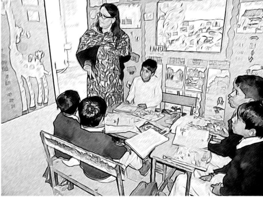
চিত্ৰ ১ যোৰত কথা পতাৰ পিছত ছাত্ৰ-ছাত্ৰীয়ে পৰ্যালোচনা কৰিছে।

যুৰীয়া কাৰ্য পাঠৰ মাত্ৰ এটা পৰ্যায়তে সীমাবদ্ধ কৰিব নালাগে। ছাত্ৰ-ছাত্ৰীক বিভিন্ন ধৰণৰ কাৰ্যৰ বাবে যোৰ পতাৰ পাৰে যেনে :-