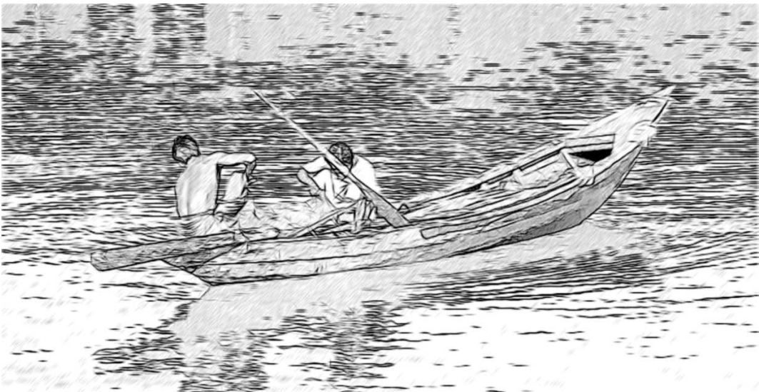
চিত্ৰ-১ মানুহ জনে নৈখন অতিক্ৰম কৰিলে

খেলৰ সময়ত সিহঁতে এজনে আনজনৰ লগত কথা পাতি আছিল। দুজনী ছোৱালীয়ে প্ৰত্যেকেই এটাকৈ শিল বেলেগে বেলেগ পাত্ৰৰ ভিতৰত দি টাবৰ পানীৰ ওপৰত ভাহি থকাৰ ব্যৱস্থা কৰিছিল। যেতিয়া মই সিহঁতক শুধিছিলো সিহঁতে কি কৰি আছে, সিহঁতে কলে যে মানুহবোৰক আৰু ল'ৰাবোৰে ৰাষ্টাৰ ইটো পাৰৰ পৰা সিটো পাৰলৈ কুৱেৰীৰ পৰা শিলবোৰ কঢ়িয়াই আনি আছে। এজন লৰাই কৈছিল, যদি মই এটা পাত্ৰতে আটাইবোৰ শিল ভৰাই দিওঁ তেনেহলে এই প্ৰতি যাটো অলপ খৰ হব। তেওঁ এইটোৱেই কৰিছিল আৰু ফলত শিল থকা পাত্ৰটো টাবৰ পানীত ডুবি গৈছিল। আন এজন লৰাই কৈছিল যে, এবাৰত মাত্ৰ এটা শিলহে দিব লাগে। এইখিনিতে ছোৱালী এজনীয়ে তেওঁৰ দেউতাকে কেনেকৈ গাওঁৰ মানুহবোৰক নদীৰ ইটো পাৰৰ পৰা সিটো পাৰলৈ নাৱেৰে কঢ়িয়াই লৈ যায় এই প্ৰসংগ দি এবাৰত যে মাত্ৰ এজন ব্যক্তি কহে সৰবৰাহ কৰিব লাগে, এই কথাটোত হয়ভৰ দিছিল।