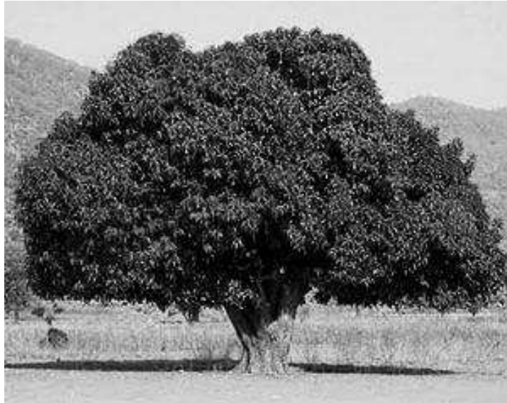
Figure R2.1 A mango tree.

I will be a maple very tall, Losing my leaves when it is fall. But when it is spring, new leaves will show. How do trees grow? Now you know!