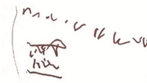
চিত্র 1 একটি চার বছরের মেয়ের 'লেখা'।

চিত্র 1 দেখুন, যেখানে চার বছরের একটি মেয়ের 'লেখা' দেখানো হয়েছে। সে তার প্রাক-বিদ্যালয় শিক্ষককে আত্মবিশ্বাসের সঙ্গে বলেছিল যে, সে সংখ্যা ও বর্ণগুলি লিখেছে। একটি লেখা হিসেবে আপনি একে কীভাবে মূল্যায়ন করবেন, না কি আপনি এটিকে শুধুই হিজিবিজি বলে মনে করেন? এই লেখাটি সম্বন্ধে আপনার বিদ্যালয়ের অন্যান্য শিক্ষক/শিক্ষিকার সঙ্গে কথা বলুন। এ ব্যাপারে তাঁদের প্রতিক্রিয়া কী?