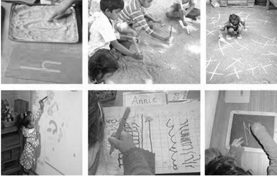
চিত্র 2 শিক্ষার্থীরা যেখানে লিখতে পারে তার কয়েকটি উদাহরণ: বালির মধ্যে আঙ্গুল চালিয়ে; বালির বাইরে কাঠি দিয়ে; ফুটপাতের উপর চক দিয়ে; দেওয়ালের উপর রং দিয়ে; পুনর্ব্যবহৃত কাগজে কলম দিয়ে; এবং বোর্ডের উপর চক দিয়ে।