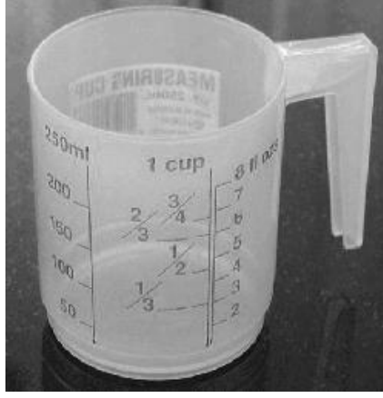
চিত্র 1 ঘরোয়াভাবে পরিমাপ করার একটি কাপ বা জগ

তরলের আয়তন, বা চালের দানার মতো ছোট আলগা বস্তুর পরিমাণ, সেগুলিকে মাপার কাপের মতো একটি পরিমাপ করার উপকরণে তেলে পরিমাপ করা যেতে পারে (চিত্র 1)।