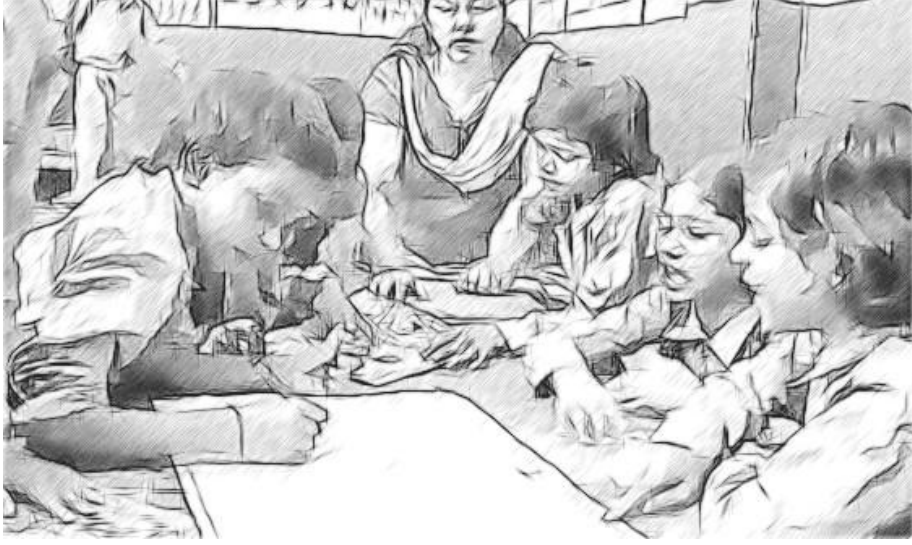
চিত্র ২ একটা দল একটা গল্পের উপর কাজ করছে

আমি তারপর গল্পটা চার্ট কাগজে লিখে সেটা শ্রেণিকক্ষের দেওয়ালে ঝুলিয়ে দিই, তার শেষে অংশগ্রহণকারী শিক্ষার্থীদের নাম দেওয়া থাকে।