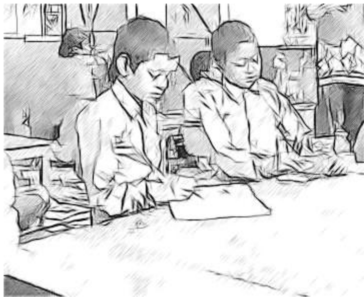
চিত্র ৩ একটা চিঠি লেখা

আমার শিক্ষার্থীরা স্থানীয় প্রশাসনকে একটা প্রতিবাদ পত্র লিখতে চাইছিল। আমি তাদের এটায় সাহায্য করতে রাজি হয়েছিলাম। আমি ছ'টা দলের প্রত্যেকটাকে একটা করে কাগজ দিয়ে বললাম বাজার সরানোর পরিকল্পনার বিষয়ে তাদের মূল বক্তব্যগুলো লিখে ফেলতে।