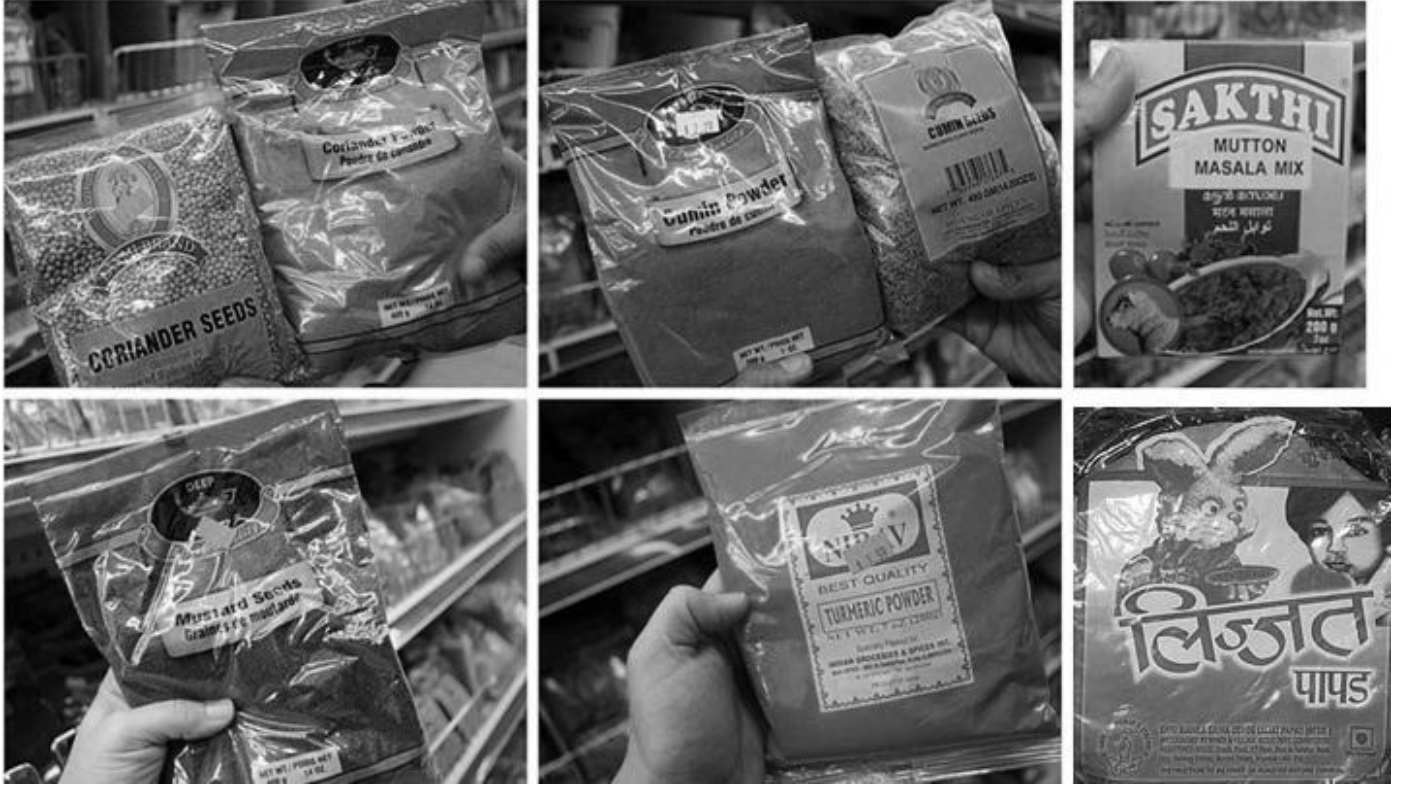
চিত্র ১ খাবার মোড়ক-এর ওপরে লেখার উদাহরণ

আমি শ্রেণিতে মোড়কগুলো নিয়ে আসি এবং আমার শিক্ষার্থীদের দেখানোর জন্য একটা নির্বাচন করি। এটা একটা আমের পানীয়ের বাক্স ছিল। আমার বেশ কিছু শিক্ষার্থী সেটি চিনতে পারে, কারণ তারা নিজেরা এটা পান করে।