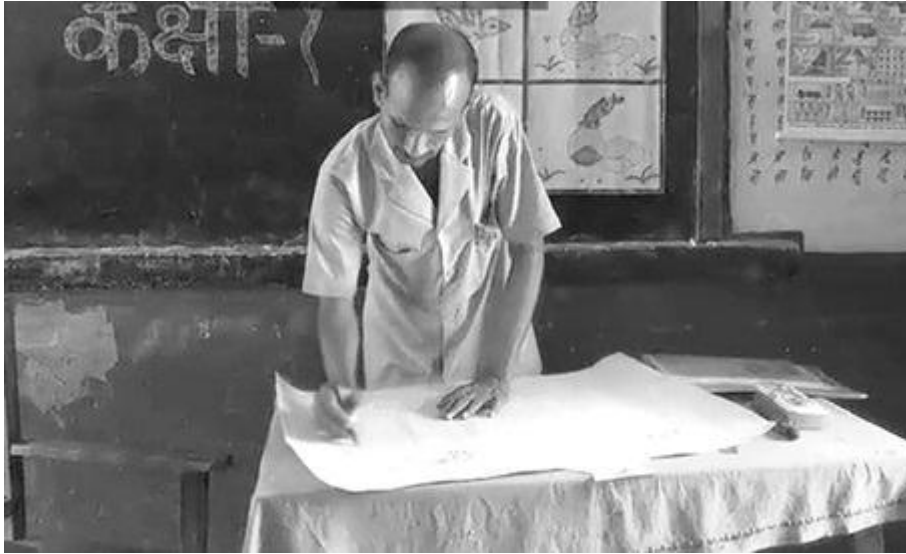
চিত্র 3 জুটিতে কাজের একটা পাঠ পরিকল্পনা তৈরি করা

সম্পদ 1-এর ধারণা ও নির্দেশনা ব্যবহার করে এবং কেস স্টাডি 1 ও 2 কাজে লাগিয়ে, একটা বিষয় নির্বাচন করুন, যা নিয়ে বলতে ও লিখতে আপনার শিক্ষার্থীদের প্রণোদিত করা হবে। আপনি আপনার শ্রেণির ভাষা এবং সাষ্করতা পাঠ্যবইয়ের কোনো অধ্যায়ের ওপর অথবা অন্য বিষয়, জনগোষ্ঠীর সাম্প্রতিক কোনো অনুষ্ঠান, বা স্থানীয় অথবা জাতীয় খবরের ওপর নির্ভর করতে পারেন। জুটিতে কাজের আগে আপনার শিক্ষার্থীরা অনুপ্রেরণার জন্য কী পড়তে পারে, অথবা এর পরে কী কী পড়ার সুযোগ থাকতে পারে তা বিবেচনা করুন।