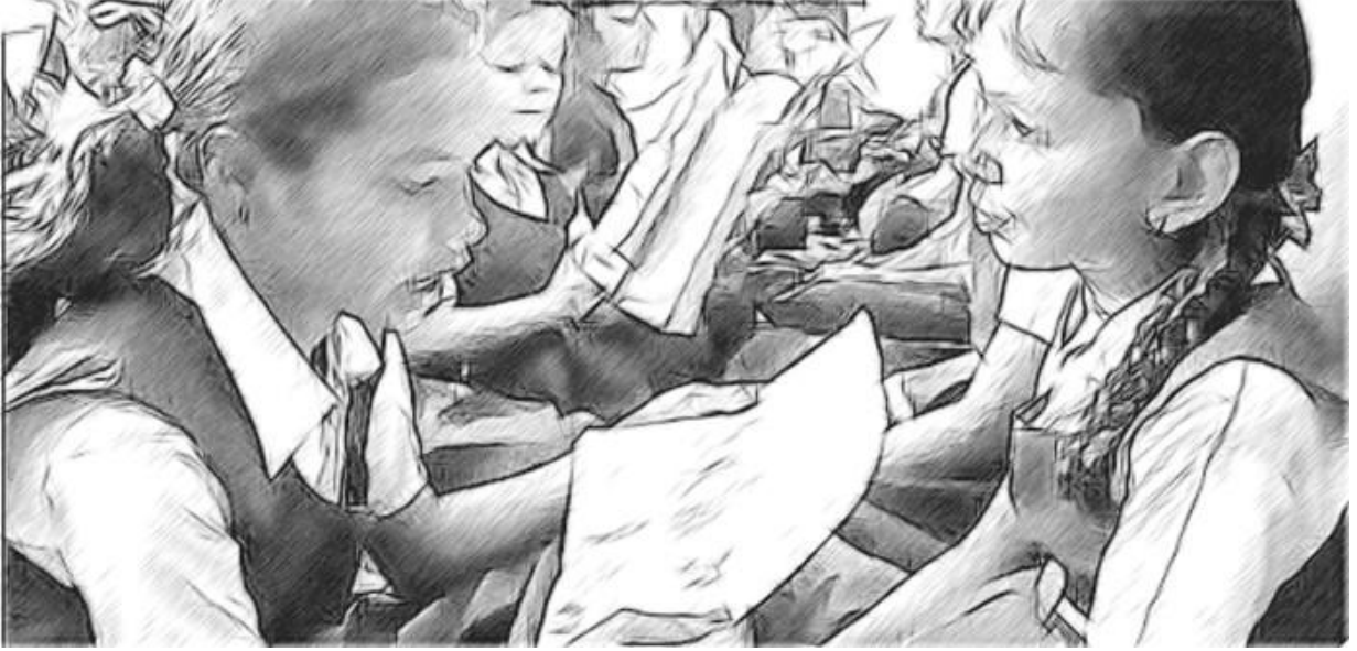
চিত্র 1 'বেজি আর কেউটে' র অ্যাক্টিভিটি

ক্রিয়াকলাপের সাথে বিভিন্ন কন্ঠস্বর ব্যবহার করে দুটো প্রাণীর মধ্যে সংলাপ তৈরি করতে আমি তাদের 15 মিনিট সময় দিয়েছিলাম। কিছু শিক্ষার্থী সংলাপের জন্য তাদের নিজের ভাষা ব্যবহার করতে অথবা তাদের নিজের ভাষা ও বিদ্যালয়ের ভাষা মিশ্রণ ব্যবহার করা পছন্দ করেছিল। তাদের কাজের সময়, আমি তাদের দেখাশুনা করি আর তাদের অনুরোধে বোর্ডে মূল শব্দগুলো লিখে চলি। অনেক শিক্ষার্থী খুব প্রাণবন্তভাবে কথা বলছিল।