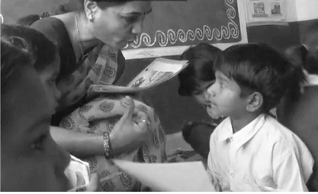
চিত্র 2 জুটিতে কাজ নিরীক্ষণ করা

মূল্যায়ন শিক্ষার্থীদের ভাষা বিকাশের সাথে সম্পর্কিত হতে পারে, যেমন তাদের: