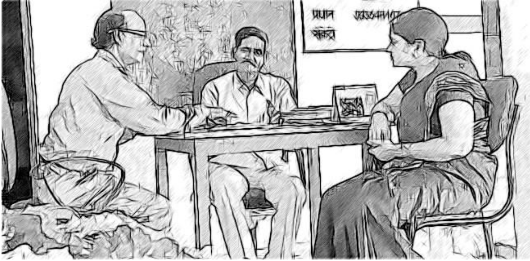
চিত্র 2 সহকর্মীদের কাজ অর্পণ করা।