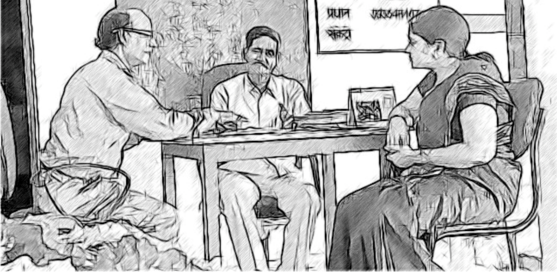
ಚಿತ್ರ 3 ಸಹೋದ್ಯೋಗಿಗಳಿಗೆ ಹೊಣೆ ವಹಿಸುವುದು.