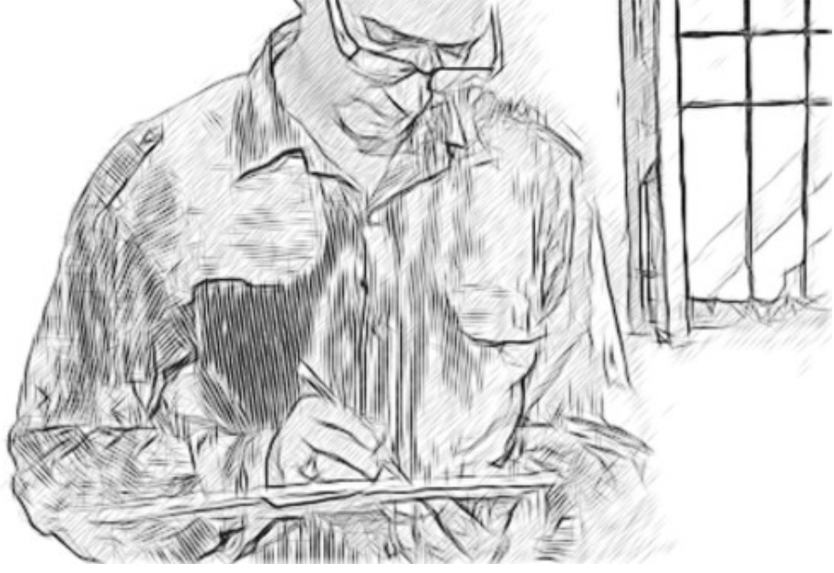
চিত্ৰ : ২ বিচিত্ৰতাৰ মানচিত্ৰ অংকণ

তলৰ 1 নং টেবুলত দেখুৱাৰ দৰে এখন টেবুল ব্যৱহাৰ কৰি খবৰবোৰ সম্পূৰ্ণ কৰক যাতে আপোনাৰ হাতত বৰ্তমান থকা তথ্যবোৰ যিমান পাৰে সিমান আপুনি ব্যৱহাৰ কৰিব পাৰে। টেবুলখনৰ বাওঁহাতে থকা স্তম্ভত ছাত্ৰ ছাত্ৰীসকলৰ শিকনত অংশ গ্ৰহণ কৰাত প্ৰভাৱ পেলোৱা কাৰকৰ এখন তালিকা পাব। আপোনাৰ ছাত্ৰছাত্ৰীসকলে প্ৰতিনিধিত্ব কৰা ধৰ্ম আৰু ভাষাৰ পৰিসৰক নিৰ্দিষ্টকৈ দেখুৱাৰ বাবে পাছত আপুনি শ্ৰেণী /বৰ্গসমূহক পুনৰ বিভাজিত কৰাৰ বাৰুকৈয়ে প্ৰয়োজন হ'ব পাৰে।