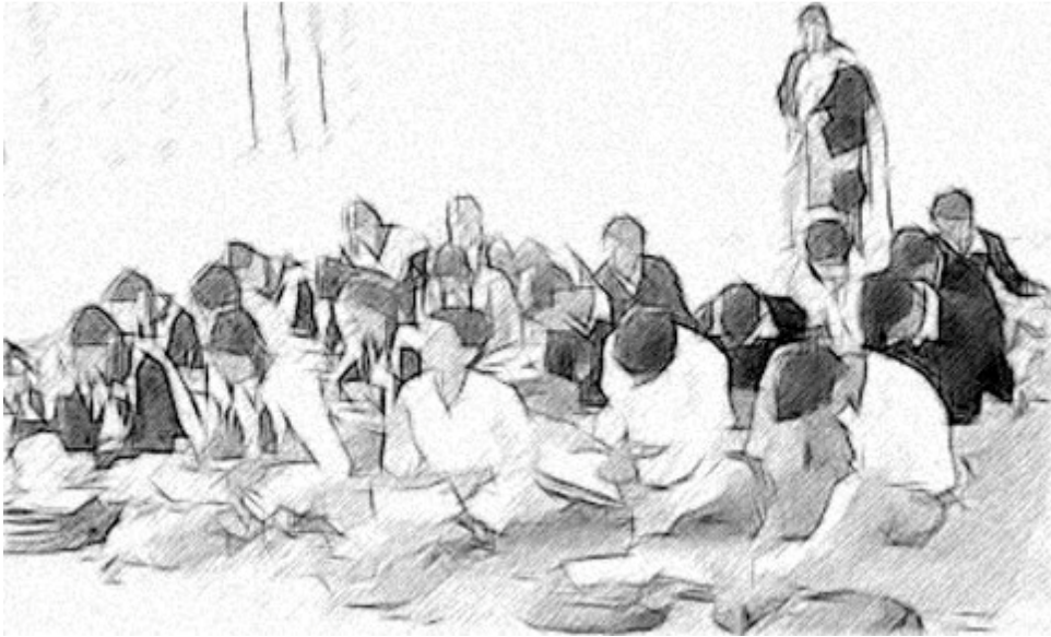
চিত্ৰ ১ : প্ৰতিখন বিদ্যালয়তে বিচিত্ৰতা আছে

জাতি, বৰ্ণ, ধৰ্ম, ভাষা,লিংগ ইত্যাদি নিৰ্বিশেষে সকলোকে সামৰি এখন সংগঠিত সমাজ গঠন কৰি যাতে বিচিত্ৰতাক উদ্‌যাপন কৰিব পাৰি তাৰ বাৰি ধাৰাবাহিকভাৱে সফল চৰকাৰবোৰে শিক্ষাৰ মূল নীতি ৰূপে স্বীকৃতি দি আহিছে। বিদ্যালয়ৰ এজন মুখ্যব্যক্তি বা নেতা হিচাপে আপোনাৰ বিদ্যালয়ৰ ভিতৰত বিৰাজমান হৈ থকা বিচিত্ৰতাক আপুনি চিনাক্ত কৰিবলৈ সক্ষম হোৱা প্ৰয়োজন আৰু শিকনৰ সমল আৰু সুযোগ হিচাপে বিচিত্ৰতাক কেনেকৈ উপযুক্ত ভাৱে ব্যৱহাৰ কৰিব সেইটোও জানিবলৈ সক্ষম হোৱা প্ৰয়োজন। আপোনাৰ সকলো ছাত্ৰ-ছাত্ৰীৰ শিকন ফলাফল উন্নত কৰাৰ বাবে কৌশল প্ৰস্তুত কৰণ আৰু ছাত্ৰ-ছাত্ৰীৰ শিকণীয় ক্ষেত্ৰত এই বিচিত্ৰতাৰ বিষয়টোনো ক'ত বাধাপ্ৰাপ্ত হ'ব পাৰে সেইটো আপুনি চিনাক্ত কৰা প্ৰয়োজন।