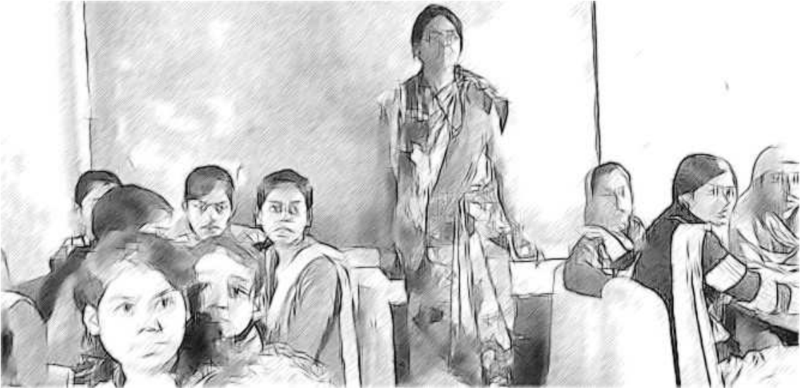
চিত্ৰ- 1 ত পৰ্যবেক্ষণৰ দ্বাৰা সাক্ষ্য সংগ্ৰহ।

যদি তুমি শ্ৰেণীকোঠা পৰিদৰ্শন কৰি ছাত্ৰ ছাত্ৰীৰ শিক্ষাৰ অধ্যয়নৰ বা শিক্ষকবোৰে কোৱা কথাবোৰ নিয়মিত ডাটা সংগ্ৰহ নকৰা, তুমি জ্ঞাতি নহৱা যে এই অধ্যয়নত ছাত্ৰ ছাত্ৰীৰ কাৰ্য সম্পাদনত কেনে ধৰণে ক্ষতি কৰিছে। সেই কাৰণে ছাত্ৰ নায়কৰ নিয়মিত লক্ষ্য প্ৰয়োজন আৰু তোমাৰ কৰিব লগাখিনি নিত্য কাৰ্য ত্ৰম কৰা উচিত হ'ব। সেইবাবে তুমি ভাল ছাত্ৰ নায়ক এজন নিযুক্তি দিব লাগে আৰু নিযুক্তি দিয়া ছাত্ৰ নায়কবোৰ শিক্ষকবোৰ হ'ব লাগে যিয়ে এইটো ভালদৰে কাৰ্য সম্পাদন কৰে।